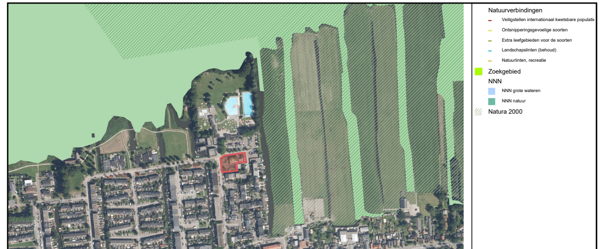
Figuur 2: ligging projectgebied (rode vlak) ten opzichte van NNN-gebieden (lichtgroene) en Natura 2000 (gearceerd).

In het projectgebied worden nieuwe woningen gerealiseerd. Een negatief effect door depositie van verzurende of vermestende stoffen op het Natura 2000-gebied