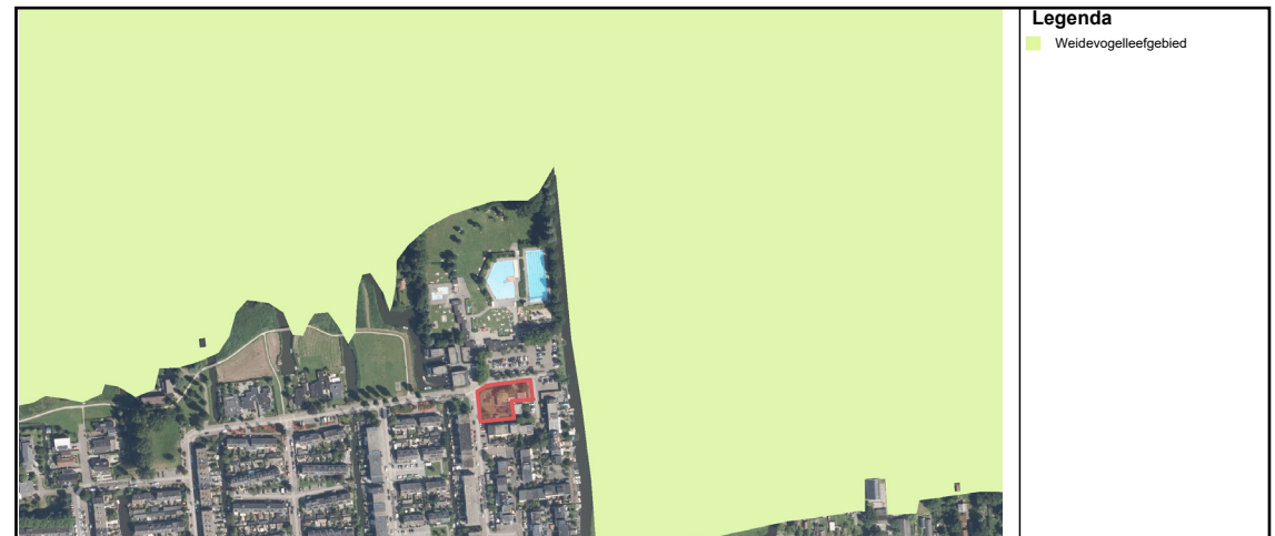
Figuur 3: ligging projectgebied (rode vlak) ten opzichte van belangrijke weidevogelgebieden (lichtgroene kleur). (Bron: Provincie Noord-Holland, 2017).