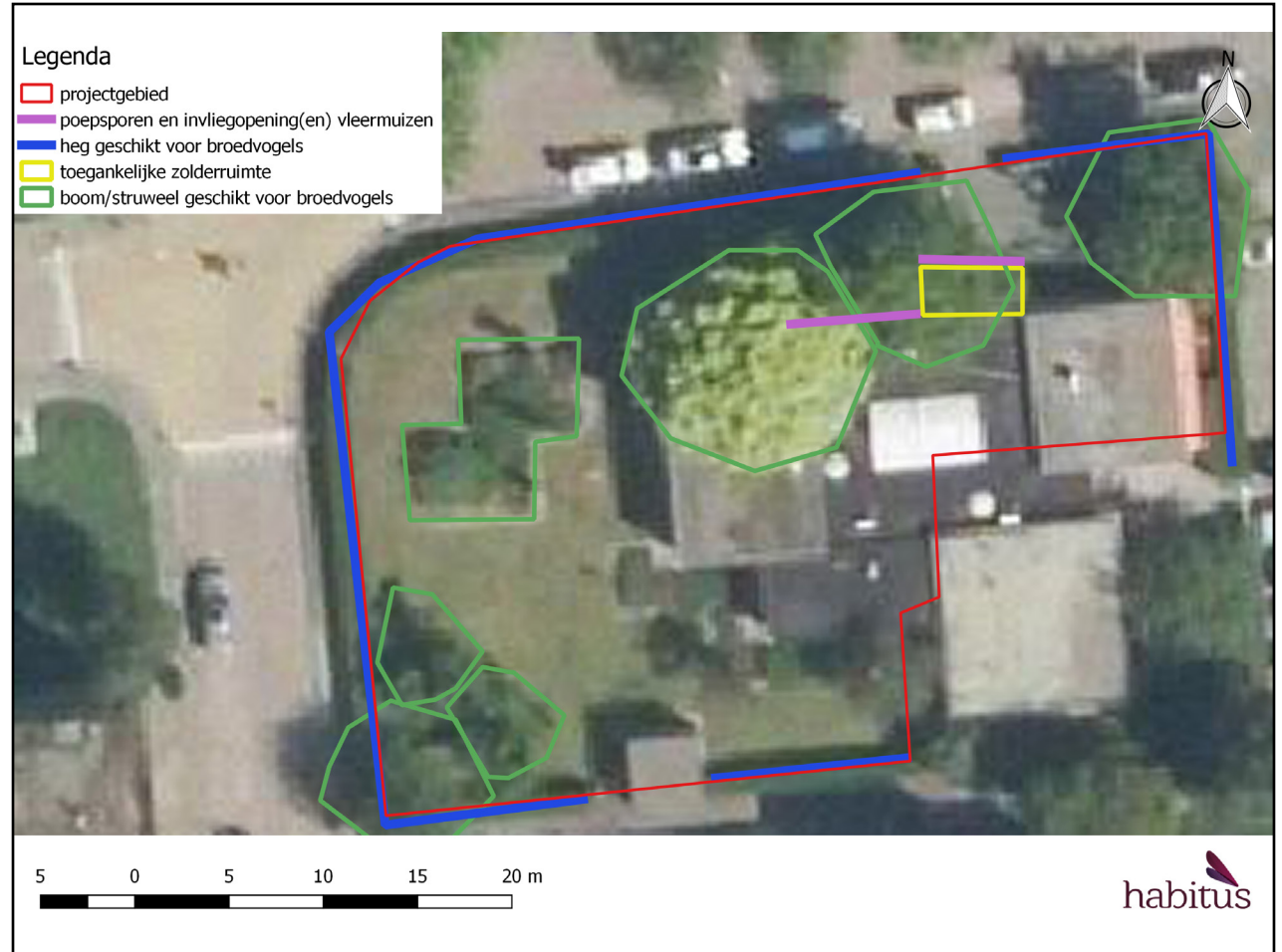
Figuur 4: kaart met het projectgebied, geschikte biotopen en relevante waarnemingen (indien aanwezig) .

verblijfplaats hebben onder de dakrand aan de voorzijde van het gebouw en in het zoldertje boven de veranda. Bij de sloop van het gebouw gaan er vaste rust- en verblijfplaatsen verloren en raken er mogelijk dieren gewond of worden gedood. Dit is een overtreding van artikel 3.5 lid 1,2 en 4 van de Wnb voor vleermuizen.