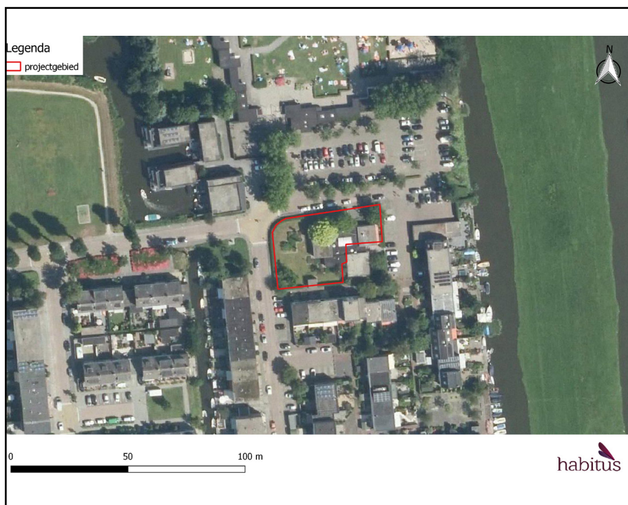
Figuur 1: het projectgebied is rood omrand (PDOK, 2016).

Het projectgebied ligt aan de Sternweg 3 te Wormer en is gelegen in de provincie Noord-Holland. De begrenzing van het projectgebied is weergegeven in Figuur 1. In de huidige situatie bestaat het projectgebied uit een voormalig bedrijfspand, een schuur en een tuin. De omgeving van het projectgebied bestaat uit bebouwing, wegen en tuinen.