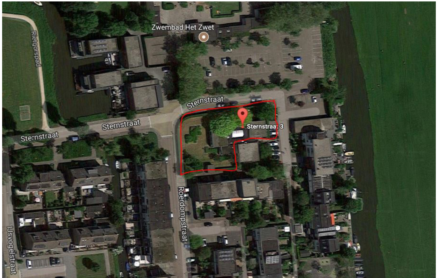
Figuur: kaart projectgebied zoals aangeleverd door de opdrachtgever