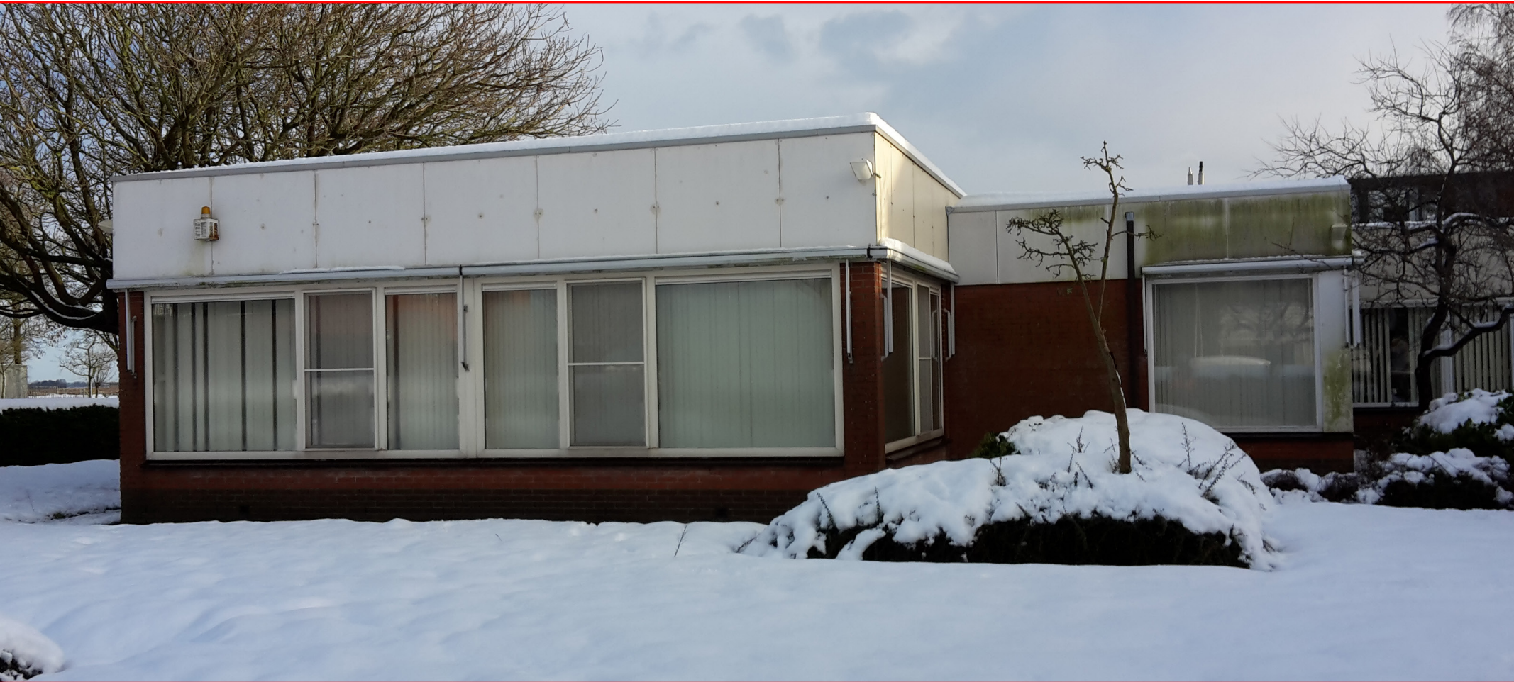
Beeldimpressie projectgebied: westzijde van het gebouw

In dit hoofdstuk wordt de aanleiding voor dit onderzoek besproken. Ook wordt het doel besproken en maakt u kennis met de centrale vraagstelling. Hierna volgen de criteria, reikwijdte en de onderzoeksopzet.