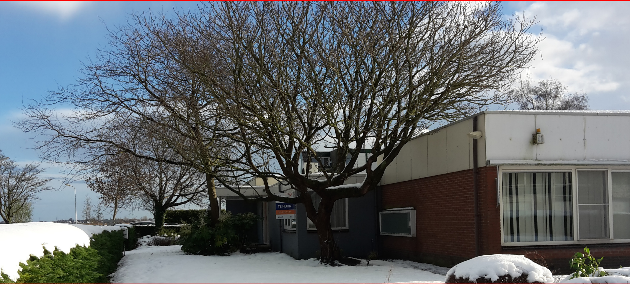
Beeldimpessie projectgebied: voorzijde gebouw

Dit hoofdstuk beschrijft de (mogelijke) aanwezigheid van beschermde soorten, functies en gebieden in en rond het projectgebied én de verwachte effecten daarop. Tevens worden de voorgenomen werkzaamheden getoetst aan de wet- en regelgeving.