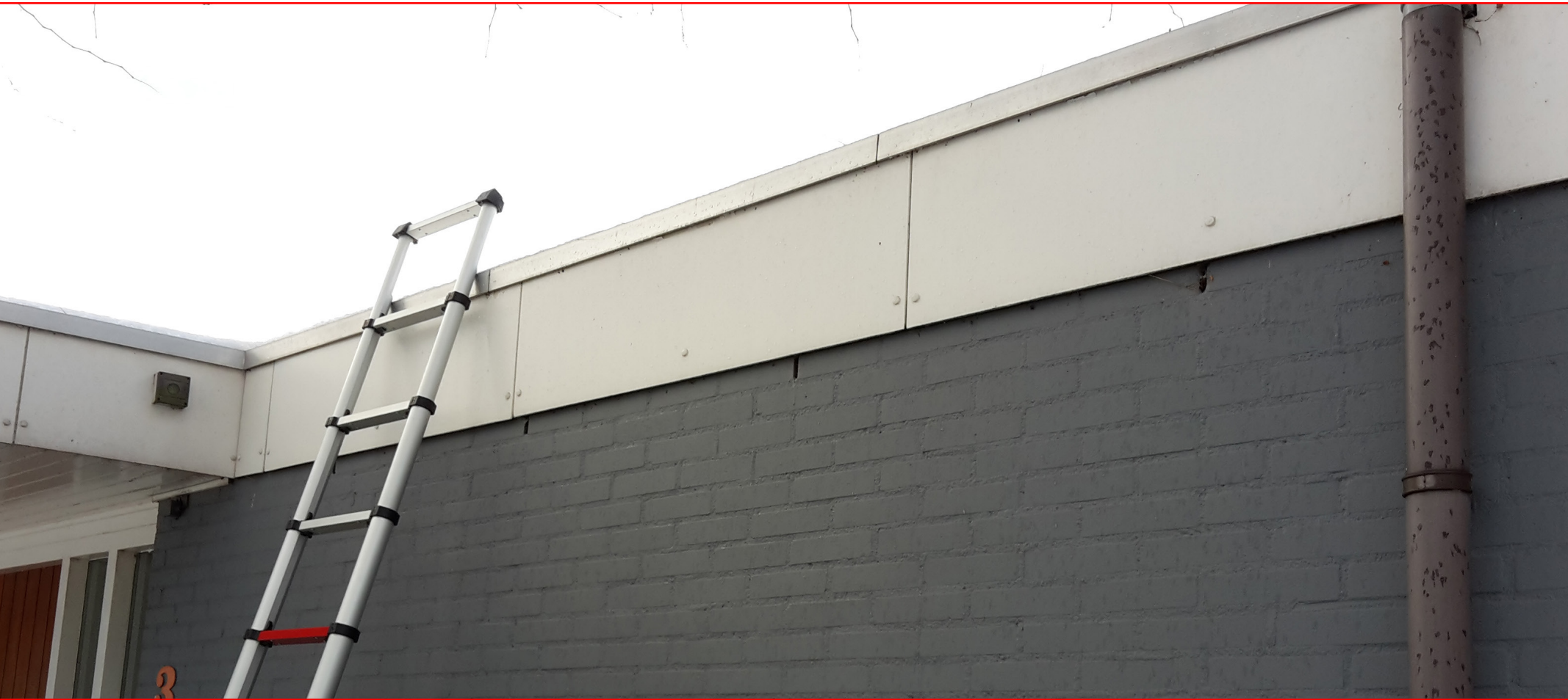
Beeldimpressie projectgebied: muur rechts van de ingang met overhangende dakrand en ventilatiegaten

Dit hoofdstuk begint met een beschrijving van de huidige situatie in het projectgebied. Daarna worden de voorgenomen werkzaamheden en de planning beschreven.