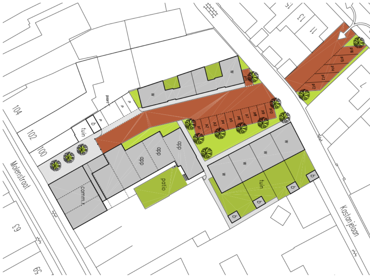
Afbeelding 2: inrichtingsvoorstel

Men is voornemens nieuwbouw te realiseren op de planlocatie.