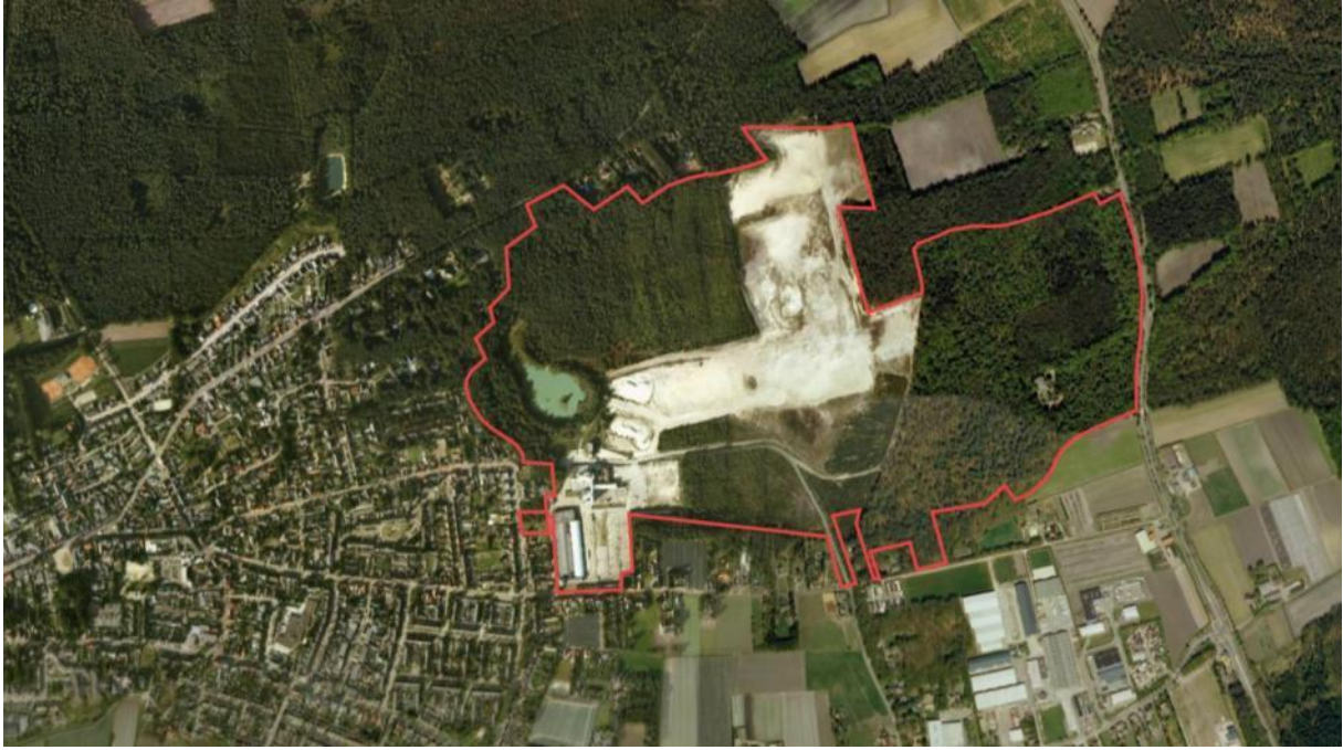
Locatie groeve Boudewijn nabij Ossendrecht