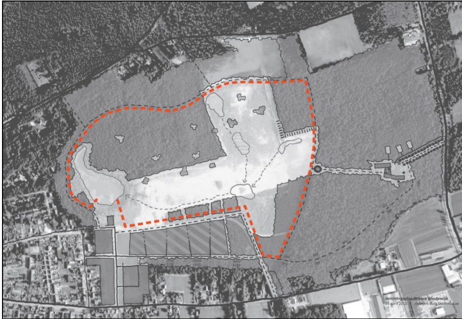
Begrenzing niet te betreden gebied

Het inrichtingsplan zal door Natuurmonumenten, die de terreinen ook in eigendom hebben en de terreinen gaan beheren, worden uitgewerkt. In deze uitwerking staan natuurdoelen centraal, overeenkomstig suggesties die in eerdere planstudies zijn weergegeven.