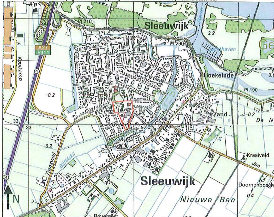
Afbeelding 1.3: Uitsnede Topografische kaart, plangebieden rood omkadert

Plangebied De Es betreft een winkelcentrum met bijhorende parkeervoorzieningen en ontsluitingswegen. De overige bebouwing in het plangebied bestaat uit een kerk en woningbouw. De rest van het plangebied bestrijkt een openbaar park. De grootte van het plangebied bedraagt circa 30.000 m 2 .