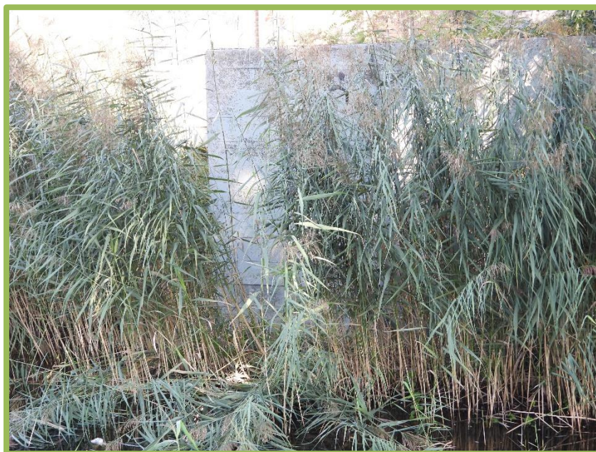
Betonnen kademuur langs de Wetering

Achteraf: opgelegd door het bevoegd gezag indien onzorgvuldig is gehandeld.