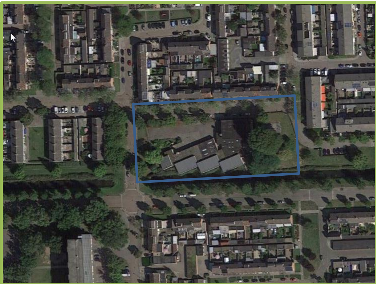
Wijnruitstraat 196 Waalwijk

De projectlocatie omvat een leegstaand schoolgebouw. Het gebouw is opgetrokken uit metselwerk, plat dak en boeijsten. Het platte dak bestaat uit bitumen dakbedekking en er zijn diverse lichtkoepels op het dak. Op het schoolplein is een kleinschalige groenstrook, bestaande uit enkele bomen, struiken en gras. De voormalige school is gelegen in de bebouwde kom van Waalwijk in de wijk Bloemenoord. Aan de zuidkant van het gebouw bevindt zich een Wetering met een rietkraag. De wal aan de zijde van de Klaproosstraat bestaat uit een grasstrook. De wal aan de zijde van de projectontwikkeling is een betonnen kademuur. De planlocatie is omringd door verharding bestaande uit klinkers (schoolplein).