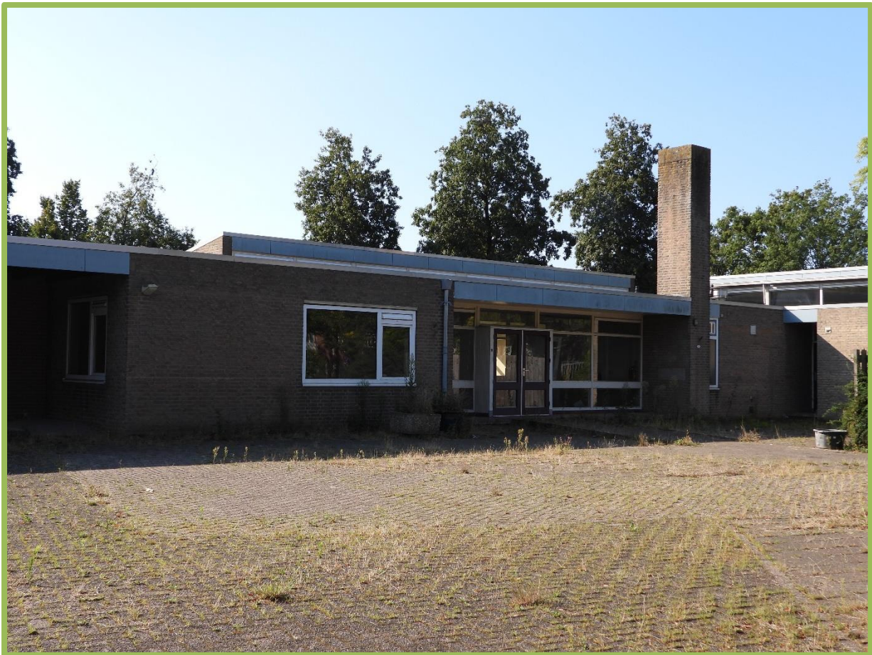
Schoolgebouw zijde Wijnruitstraat