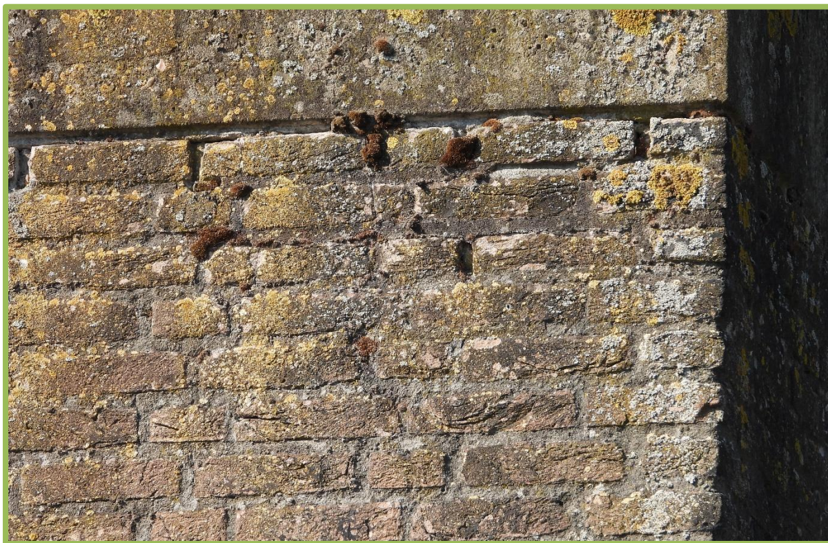
Dichte (ontoegankelijke) voegen in de schoorsteen

Vanwege de ligging ver buiten Natura 2000-gebied (op circa 2 km) is alleen het aspect stikstof relevant en zal een Aerius-berekening moeten worden uitgevoerd. Indien blijkt dat er sprake is van stikstofdepositie en effecten niet kunnen worden uitgesloten, is een Wnb-vergunning (gebiedsbescherming) vereist (art. 2.7 lid 2, Wnb). Deze wordt verleend door Provincie Noord-Brabant maar enkel onder strenge voorwaarden. Geadviseerd wordt om met het bevoegd gezag af te stemmen of een Aeriusberekening noodzakelijk is.