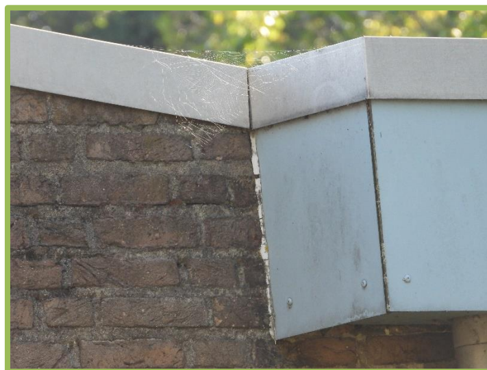
Afgedichte aansluiting boeidelen

Aan de validiteit van de effectenindicator wordt getwijfeld ten tijde van het uitvoeren van dit bureau-onderzoek. Tijdens het veldbezoek is er in het postcode-gebied van de Wijnruitstraat (5143 AJ) veel potentieel habitat en verblijfplaatsen geconstateerd voor onder meer gewone dwergvleermuis, laatvlieger en huismus. Ook de NDFP geeft in dit kilometercohort waarnemingen van genoemde soorten.