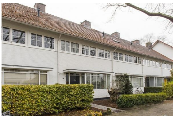
Het Witte Dorp Eindhoven – 2e Wilakkersstraat