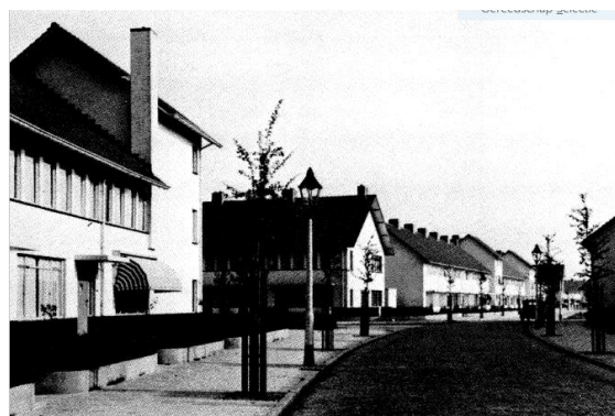
Fragment uit '50 jaar het Witte Dorp in Eindhoven.'