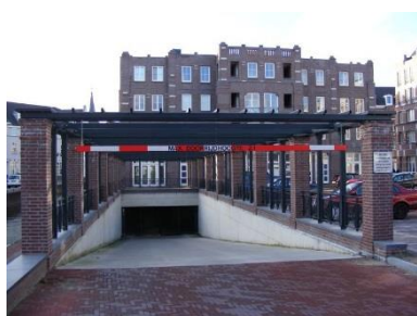
Ondergronds parkeren appartementen

Een juiste landschappelijke inpassing heeft voor deze locatie een hoge prioriteit mede omwille van het feit dat het hofje dat ontstaat de scheiding moet gaan vormen tussen de appartementengebouwen enerzijds en de grondgebonden woningen anderzijds. De ontsluiting van het terrein in combinatie met de benodigde parkeervoorzieningen en de terreininrichting moeten de wijk een eigen indentiteit en karakter geven zodat het 'Willibrordushof' duidelijk herkenbaar wordt binnen de dorpskern Waalre. Om de druk op het binnenterrein te doen verminderen is het goed voorstelbaar dat de toegang tot de grondgebonden woningen en de inrit van de parkeergarage ten behoeve van de appartementen van elkaar gescheiden worden. Het heeft de voorkeur om tegemoet te komen in de beeldvorming vanuit de Willibrorduslaan om het parkeren zoveel mogelijk plaatst te laten vinden aan de achterzijde van het terrein waardoor deze uit het zicht onttrokken zal worden. Om aan het hof en woonstraat gedachtegoed tegemoet te komen is het meest voor de hand liggend dat er vermeden wordt dat er op de weg geparkeerd gaat worden in de nieuwe wijk.