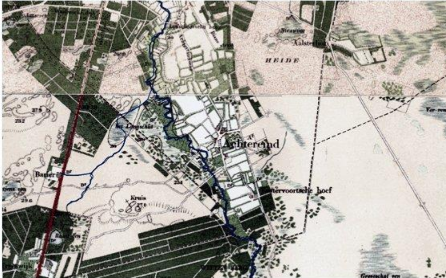
Topografische kaart van 1927.

Dat ven dat maar op één kaart vol water staat, is niet in de erfgoedkaart onder de vennen opgenomen. De Raadvenloop slingerde er dwars doorheen.