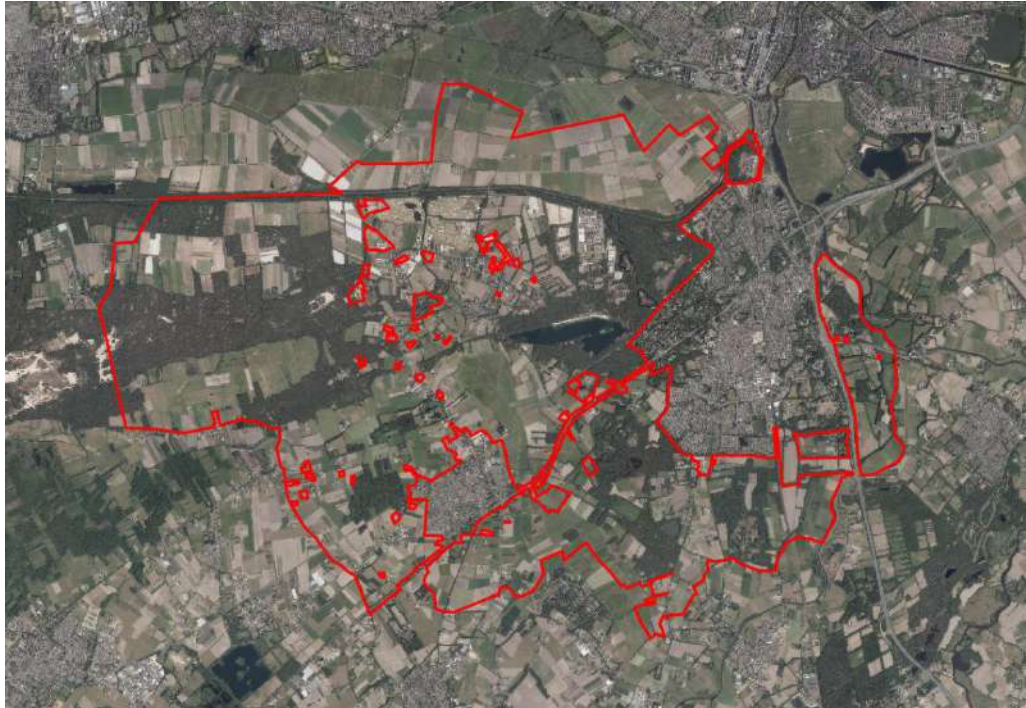
Begrenzing van het plangebied is in het rood weergegeven.