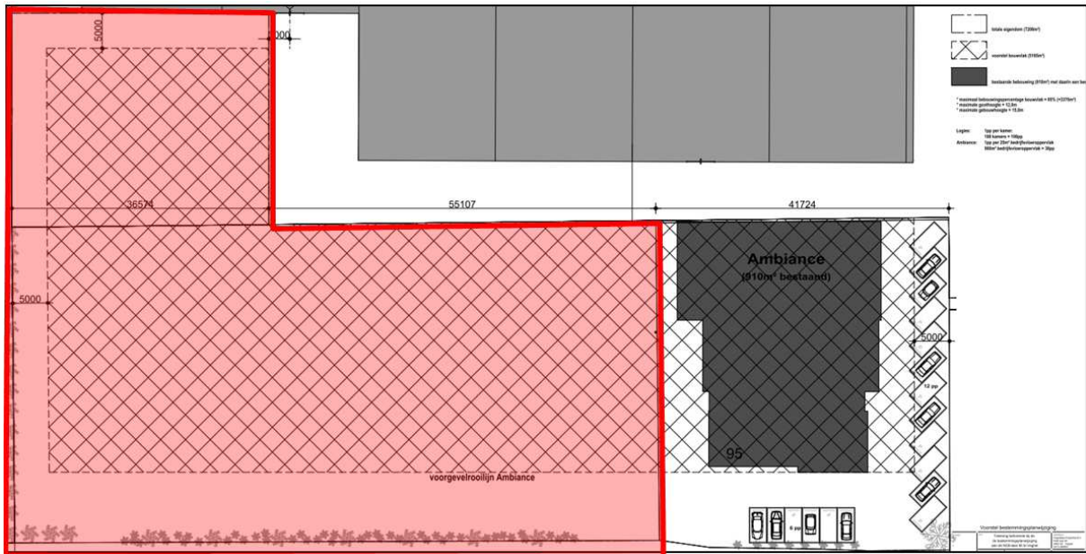
Figuur 4 Het voorgestelde plan. De beoogde footprint van het gebouw is met een rood vlak aangeduid.

Het plan voorziet in de realisatie van een zogenaamd hotel. Binnen het bouwvlak is al 910 m 2 bebouwd. Door vergroting van het bouwvlak is er ca. 5.185 m 2 bebouwing mogelijk. Bovendien zijn parkeerplaatsen voorzien. In figuur 4 is een afbeelding van het voorgestelde plan weergegeven.