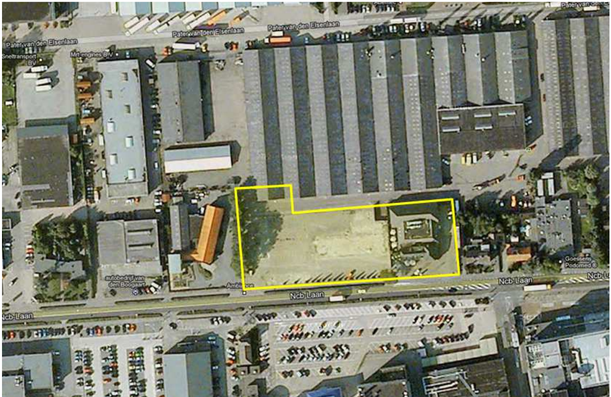
Figuur 1 Tekening plangebied

Het plangebied ligt aan de NCB-laan 95 Veghel. In figuur 1 staat met gele lijn het plangebied aangegeven.