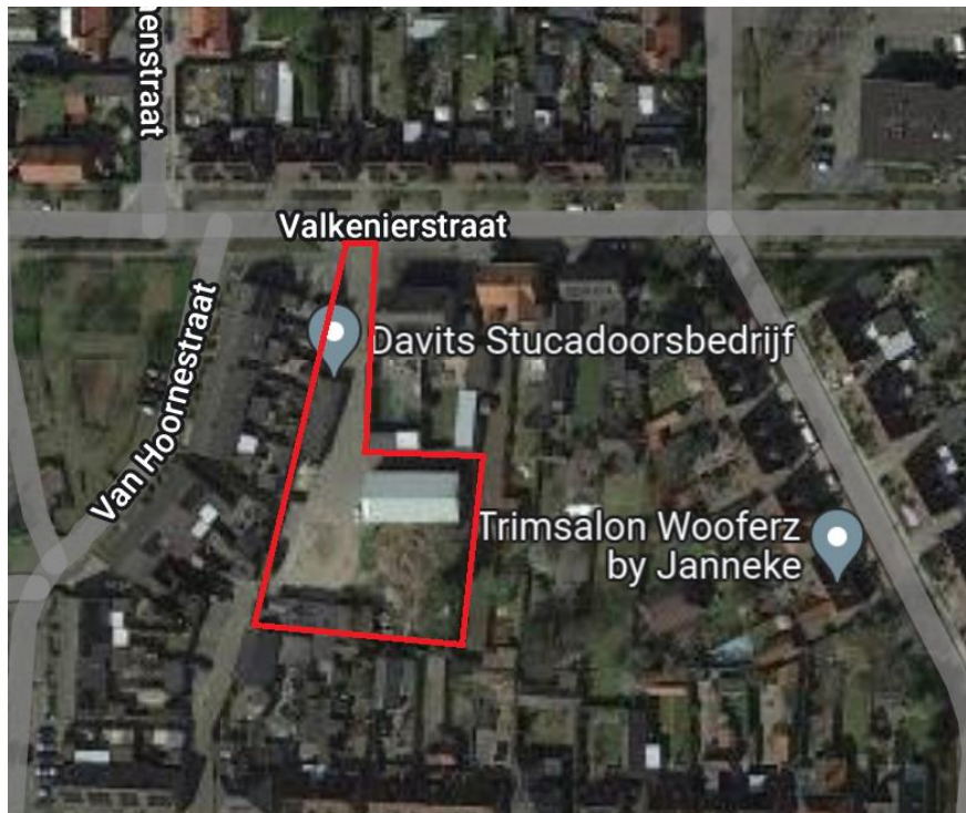
Figuur 4.1. De ligging van het plangebied (rood omlijnd).

De locatie bestaat uit een bedrijfsterrein en is gedeeltelijk verhard met klinkers. In het oosten van het terrein bevindt zich een loods, in het zuiden garageboxen en in het noordwesten een kantoorgebouw. In het zuidoosten ligt een grasveld waar diverse plantensoorten groeien zoals grote brandnetel, smalle weegbree, grote weegbree, paardenbloem, zachte ooievaarsbek, winter postelein, paarse dovenetel, Canadese fijnstraal en hondsdrif. Aan de randen van het veld staan enkele bomen zoals beuk, hulst en Noorse esdoorn.