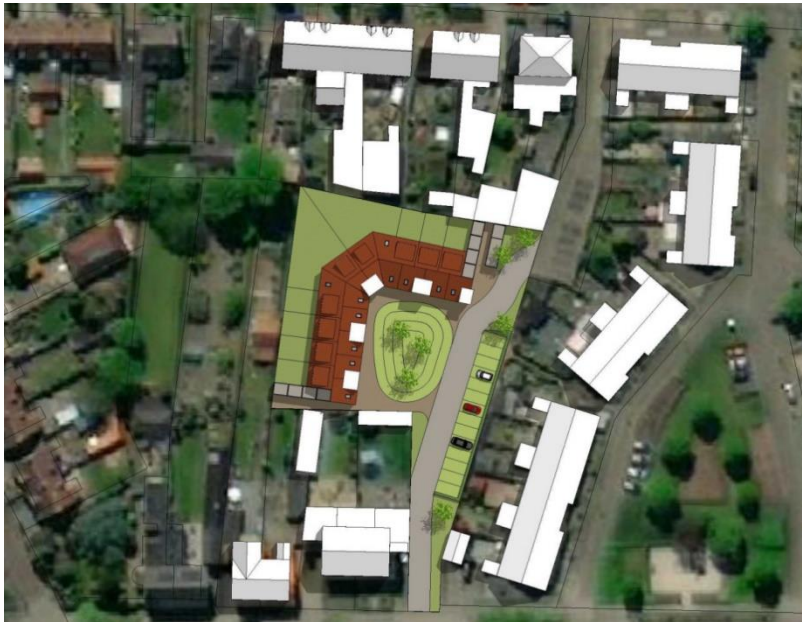
Figuur 3.1. Schets van een mogelijke toekomstige invulling.

De bebouwing in het plangebied wordt gesloopt waarna er 9 nieuwe woningen worden gerealiseerd. De aanwezige verhardingen en vegetaties worden verwijderd. Figuur 3.1 geeft een overzicht van de toekomstige situatie.