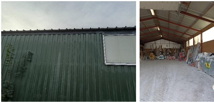
Figuur 4.4.1. De eenvoudige golfstalen gevels met ruimte bij de windveer (links) en een beeld van de binnenzijde van de loods (rechts).

De gevels en het dak van de loods bestaan uit golfstaal. Er zijn kleine openingen aanwezig tussen de gevels en de windveren (zie figuur 4.4.1), echter het oppervlak is te glad voor vogels en vleermuizen om hier het dak binnen te kunnen komen. Daarnaast is een dak van golfstaal te warm in de zomer als verblijfplaats of nestlocatie voor vleermuizen en/of vogels.