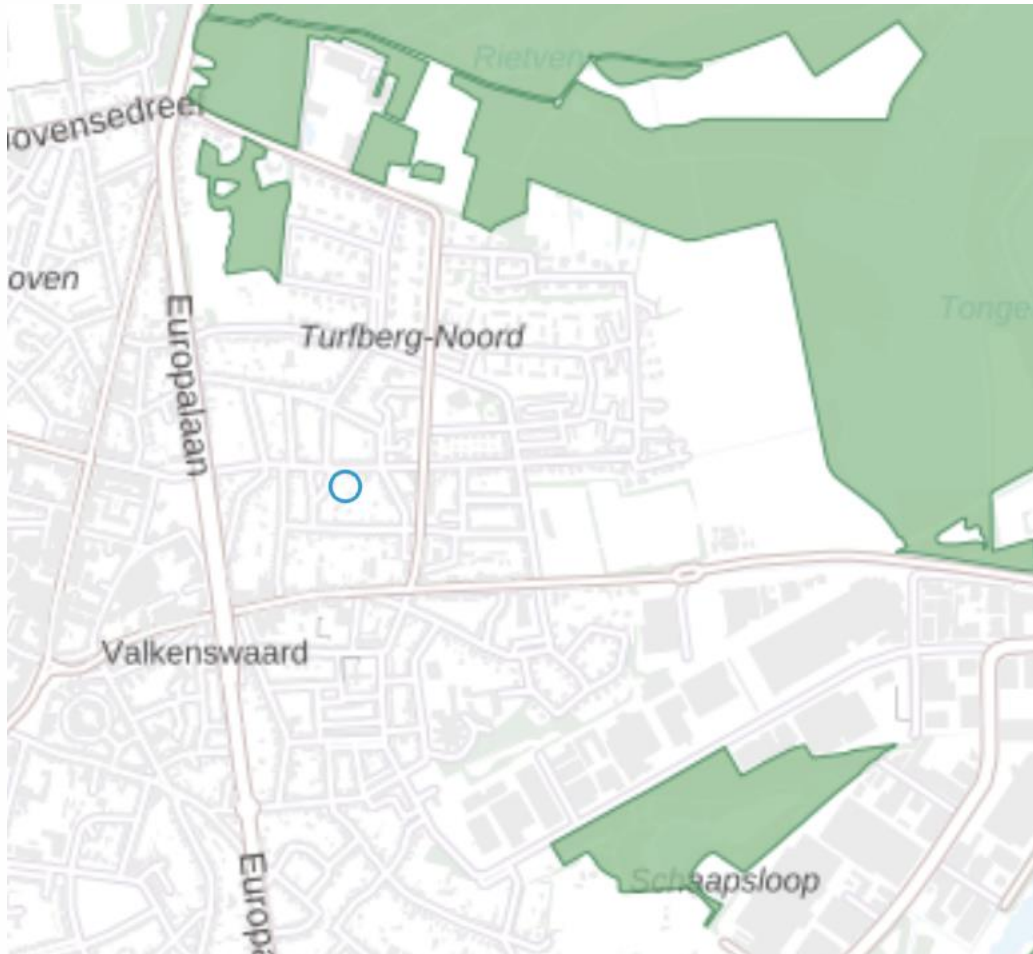
Figuur 4.3. Ligging van het plangebied (blauwe cirkel) ten opzichte van het natuurnetwerk Nederland.

Op ongeveer 470 meter ten noorden van het plangebied ligt het dichtstbijzijnde onderdeel van het Natuur Netuurnetwerk Nederland (NNN; zie figuur 4.3).