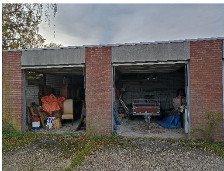
Figuur 4.4.2. De gevels van de garageboxen.

In de buitengevels van de garageboxen bevinden zich geen open stootvoegen, hierdoor hebben vleermuizen geen toegang tot de achterliggende spouw (zie figuur 4.4.2). Verder zijn er ook geen spleten of kieren onder de daktrim waar vleermuizen of vogels toegang tot het dak zouden kunnen vinden. Vleermuisverblijven of (jaarrond beschermde) vogelnesten zijn hier dus uitgesloten.