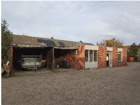
Figuur 4.4.3 Beeld van de voorzijde van het kantoor.