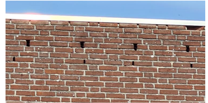
Figuur 5: Waterafvoer (boven) en open stootvoegen (onder) in de zuidgevel