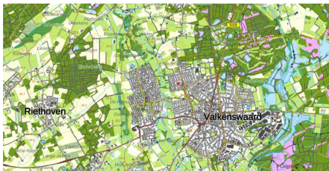
Figuur 1: Topografische kaart ligging plangebied (1:25.000)

De initiatiefnemer is voornemens de huidige bebouwing binnen het plangebied te slopen, en een appartementencomplex met 22 appartementen en een maatschappelijke plint te realiseren. Tevens zullen er enkele parkeergelegenheden worden aangelegd in het noord- en zuidwesten van het plangebied. Figuur 3 geeft een beeld van de toekomstige situatie.