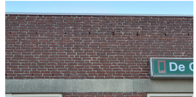
Figuur 6: Open stootvoegen in de westgevel