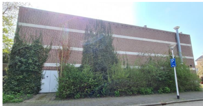
Figuur 8: Noordgevel zalencentrum