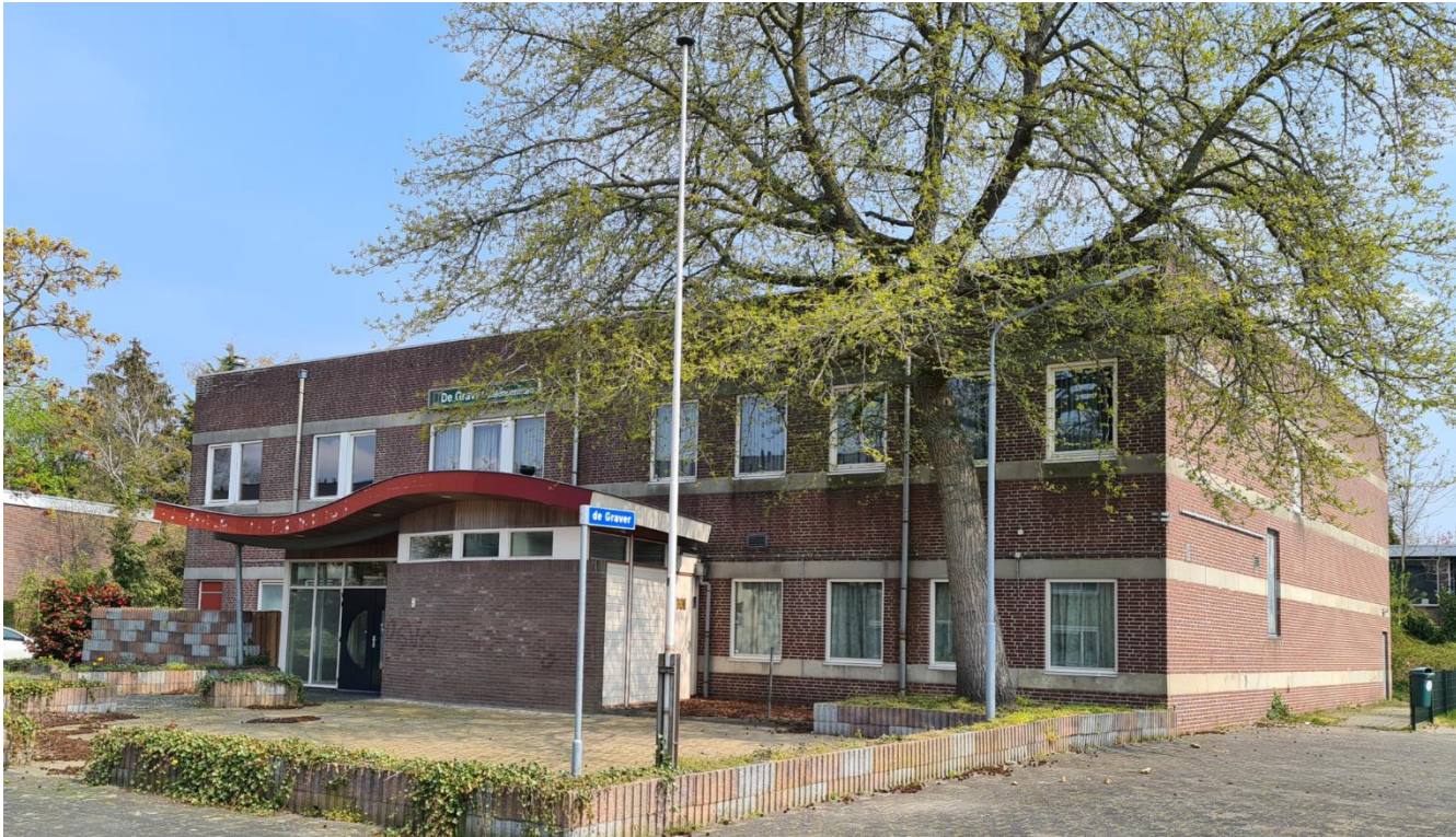
Figuur 4: Plangebied gezien vanuit het zuidwesten