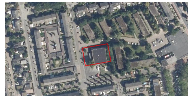
Figuur 2: Luchtfoto plangebied en directe omgeving