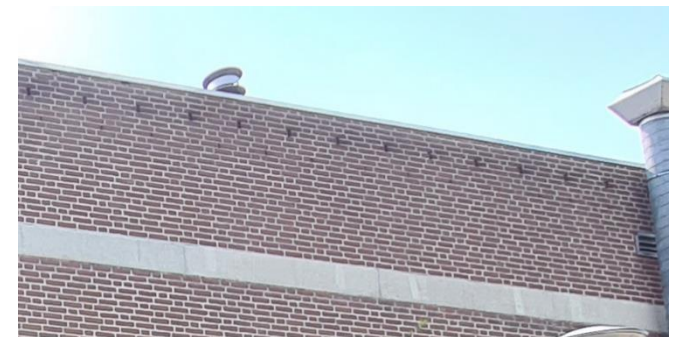
Figuur 9: Open stootvoegen in de noordgevel