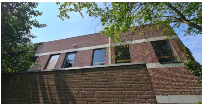
Figuur 7: Oostgevel van het zalencentrum