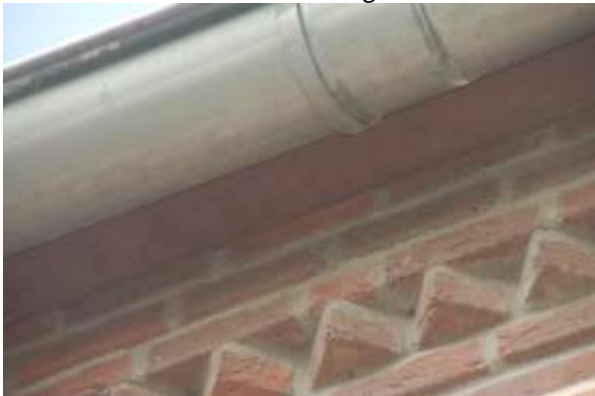
Dichte spouwmuur woning

De muren van de bedrijfswoning zijn ook volledig gesloten, zonder stootvoegen en het dak sluit naadloos aan op de muren. Onder de eerste rij pannen is ruimte voor vogels om te broeden. Tijdens het veldbezoek werd een nestelende kauw waargenomen.