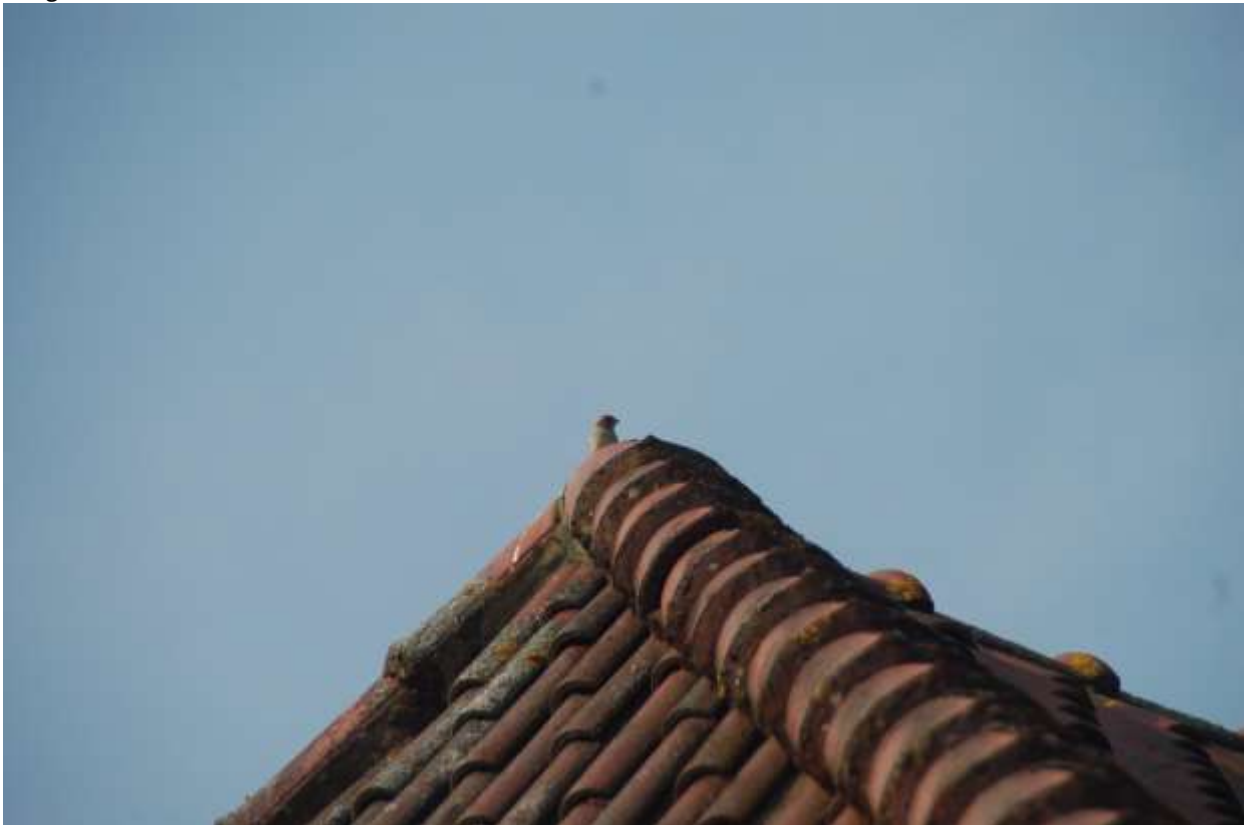
Huismus op het dak van de woning

Tijdens het veldbezoek zijn huismussen waargenomen op de te slopen bedrijfswoning en in de struiken eromheen. Deze soort is vaak in de directe omgeving van de nestplaats te vinden. Aangezien er voor huismus op de planlocatie geschikte nestgelegenheid aanwezig is onder de eerste rij dakpannen van de woning is het mogelijk dat de soort broedt op de planlocatie. Het verdere dak is goed aangesloten en aangesmeerd.