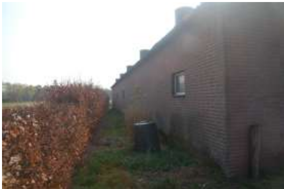
Noordelijke grens plangebied