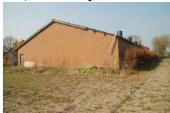
Achterzijde stal 1