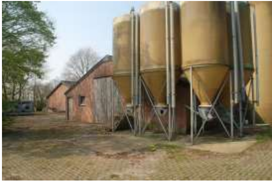
Achterzijde stal 2 en 3