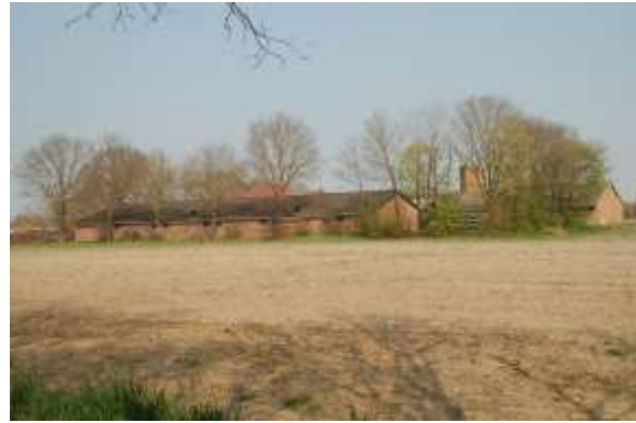
Achter aanzicht plangebied