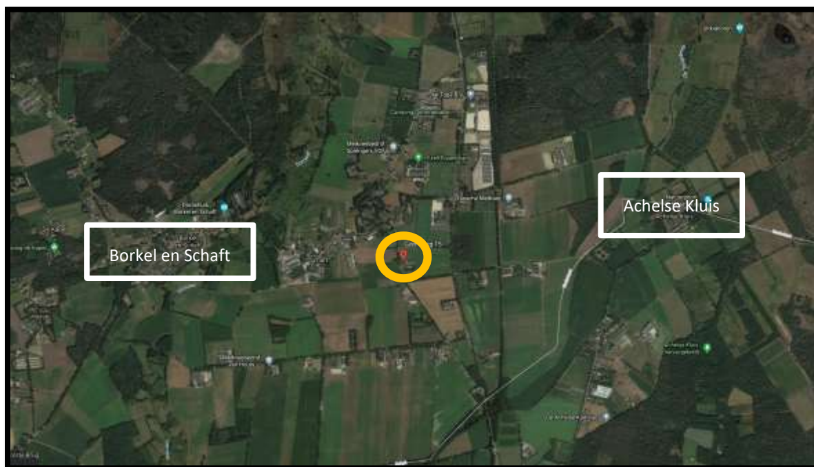
Satellietfoto omgeving plangebied, planlocatie is oranje omcirkeld.

De ligging van het plangebied in de ruimere omgeving is weergegeven in onderstaande afbeelding