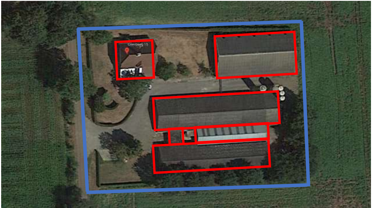
Globaal omljnd de totale planlocatie in blauw, te slopen gebouwen in rood..