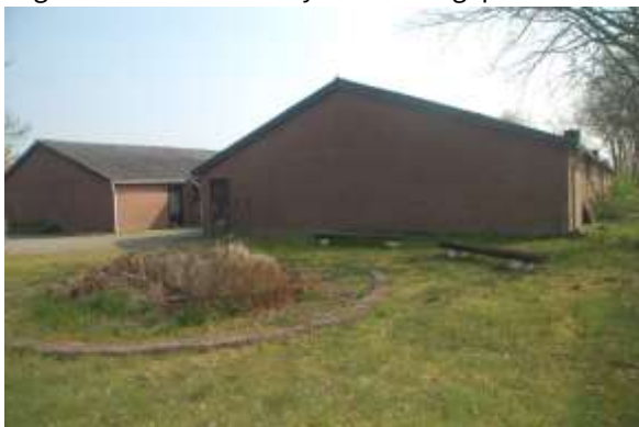
Voorzijde stallen 2 en 3

Aan de onderzijde van de golfplaten is direct dupanel bevestigd ter isolatie. De door ventilatoren aangezogen lucht komt eerst ter opwarming of afkoeling in een ruimte boven de afdelingen en gaat daarna via een zogenaamd Custers air systeem met geperforeerde damwandprofielen de afdelingen in.