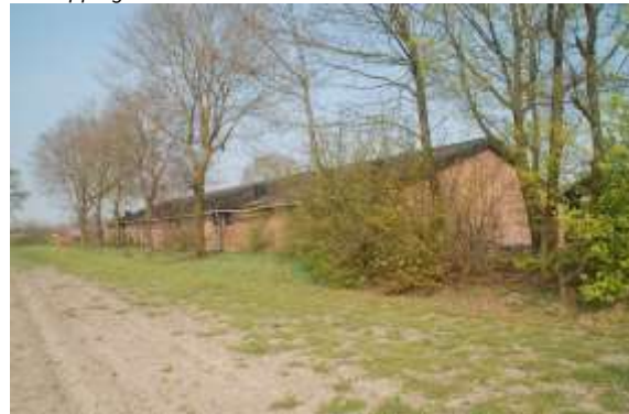
Zuidelijke grens plangebied

De bedrijfsgebouwen hebben altijd dienstgedaan in het professioneel en intensief huisvesten van varkens. Zodoende zijn er altijd afdoende maatregelen genomen om andere dieren buiten te sluiten van deze varkensstallen. Om de bio-security van het bedrijf te waarborgen zijn alle stallen rondom voorzien van vogelschroot en zijn alle luchtinlaten ook afgeschermd voor dieren.