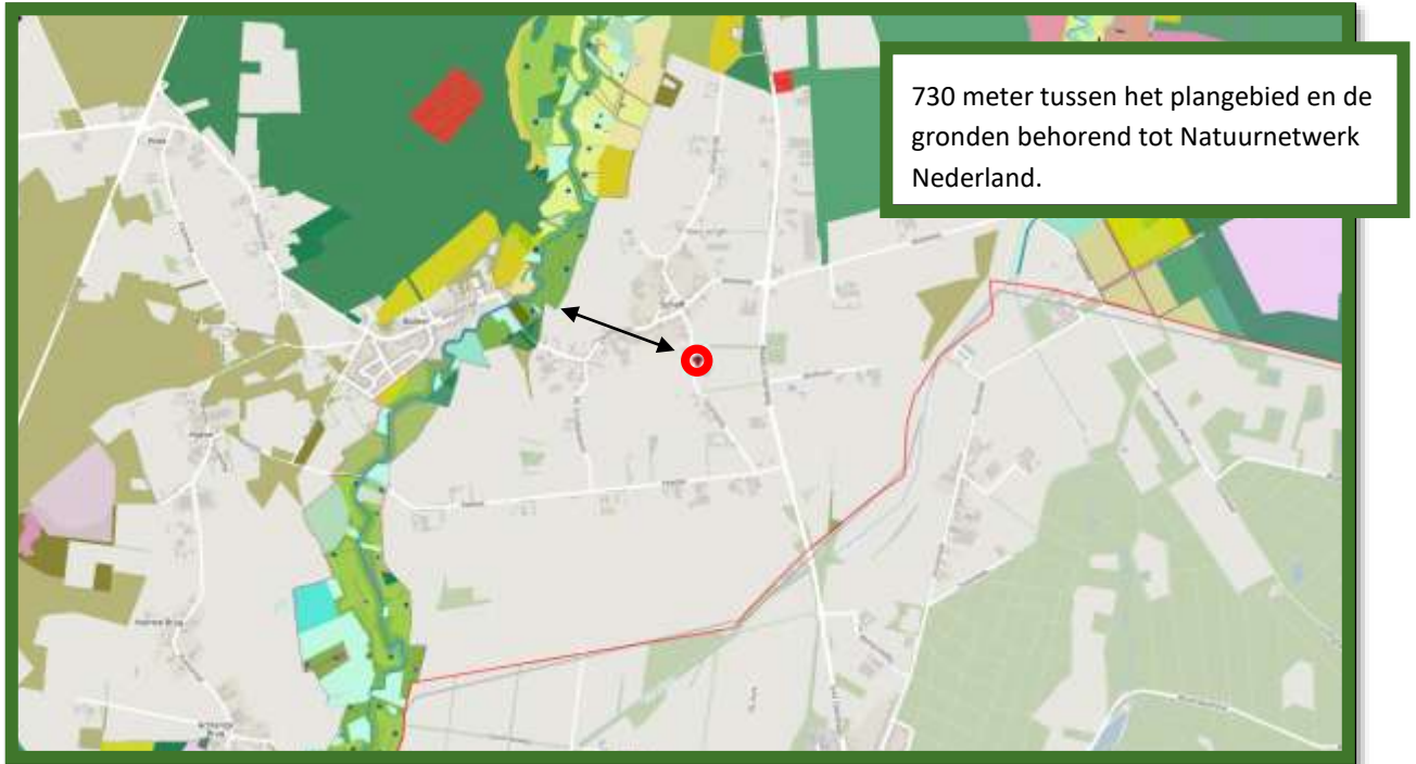
Natuur Netwerk Nederland gebieden.