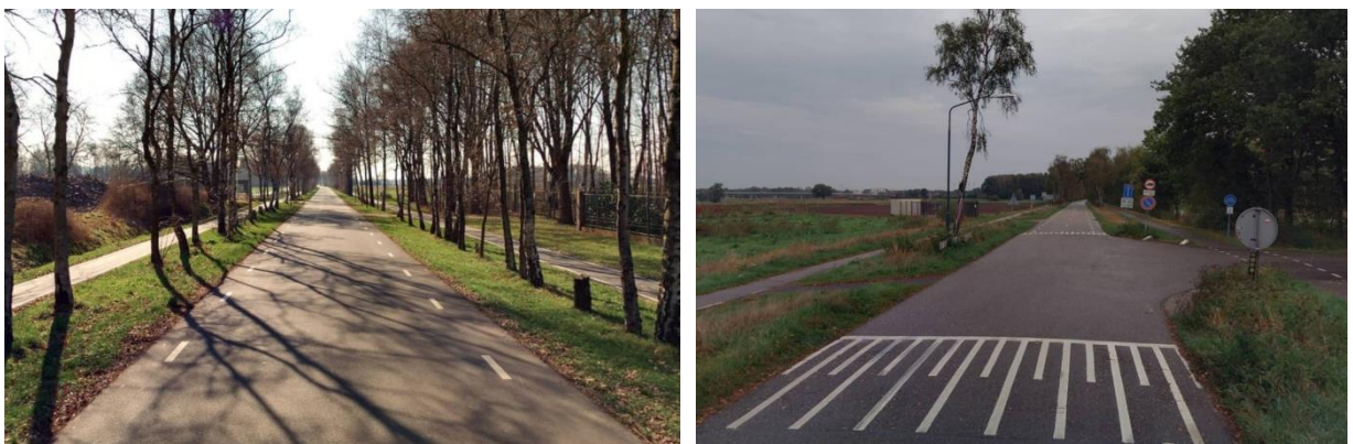
Figuur 4 Wegbeeld Monseigneur Smetsstraat en inrichting kruispunt Monseigneur Smetsstraat/Weerderdijk/ Kempervennendreef

Voor langzaam verkeer geldt dat zij gebruik kunnen maken van de vrijliggende fietspaden aan weerszijden van de Monseigneur Smetsstraat (Figuur 4). Zij conflicteren hierbij niet met het gemotoriseerde verkeer. Voor langzaam verkeer vormt het oversteken van het kruispunt Monseigneur Smetsstraat/Weerderdijk/ Kempervennendreef wel een aandachtspunt (Figuur 4). Bij het oversteken kunnen zij niet gebruik maken van een gefaseerde oversteek met een middeneiland.