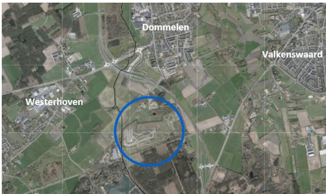
Figuur 1 Ligging plangebied (blauwe cirkel) en gemeentegrens (zwarte lijn)

Het Eurocircuitterrein is gelegen aan de westzijde van de gemeente Valkenswaard, grenzend aan de gemeente Bergeijk. Ten noorden ligt Dommelen, ten noordoosten is Valkenswaard gelegen en aan de westzijde bevindt zich Westerhoven. In Figuur 1 is de ligging van het plangebied (blauwe cirkel) en de gemeentegrens (zwarte lijn) weergegeven. Het Eurocircuitterrein wordt ontsloten door de Monseigneur Smetsstraat in het noorden, ten zuiden door de Victoriedijk en in het westen door de Kempervennendreef. Via de Kempervennendreef kan de N69 en bovenliggend wegennet worden bereikt.