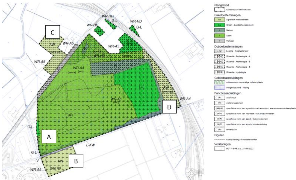
Figuur 2 Parkeerlocaties gedurende wedstrijddagen

Uit Tabel 4 blijkt dat een groot evenement als MXGP in totaal een parkeervraag genereert van circa 3.500 motorvoertuigen per wedstrijddag. In Fout! Verwijzingsbron niet gevonden. komt naar voren dat