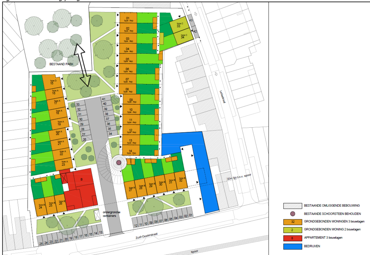
Figuur 1: Verkaveling plangebied Zuid-Oosterstraat

De ontsluiting van de bedrijfsunits vindt plaats via een interne ontsluiting op de Zuid-Oosterstraat. De nummering van de units is van zuid naar noord van 1 t/m 4. Het oppervlak van de bedrijfsunits varieert van 67 m 2 tot 156 m 2 . Alle bedrijfsunits hebben voor de eerste bouwlaag een bouwhoogte van 4,5 meter. Bedrijfsunit 2 beschikt over een tweede bouwlaag. Deze loopt over interne ontsluitingsweg en grenst aan de oostgevel van de woning op kavel 32.