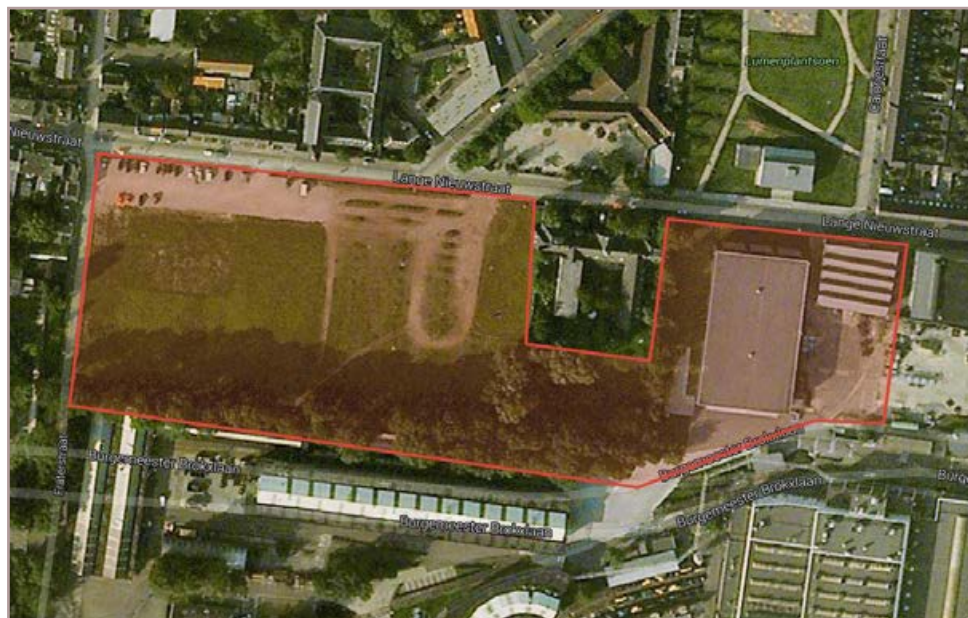
Figuur 1 Globale begrenzing van het plangebied op een luchtfoto van Google.

Het plangebied Clarissenhof ligt binnen de bebouwde ten noorden van centraal station Tilburg en wordt in het noorden begrensd door de Lange Nieuwstraat, in het westen door de Fraterstraat en in zuiden door de recentelijk aangelegde Burgemeester Brokxlaan (figuur 1). Het gebied omvat een halfverhard / onverhard parkeerterrein en braakliggend terrein,