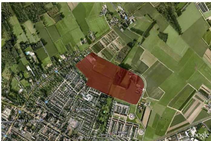
Kaart 1: Plangebied Den Bogerd Udenhout

Op meerdere plaatsen in en direct rondom het plangebied zijn activiteiten van dassen (wissels, wroetsporen) geconstateerd (kaart 2).