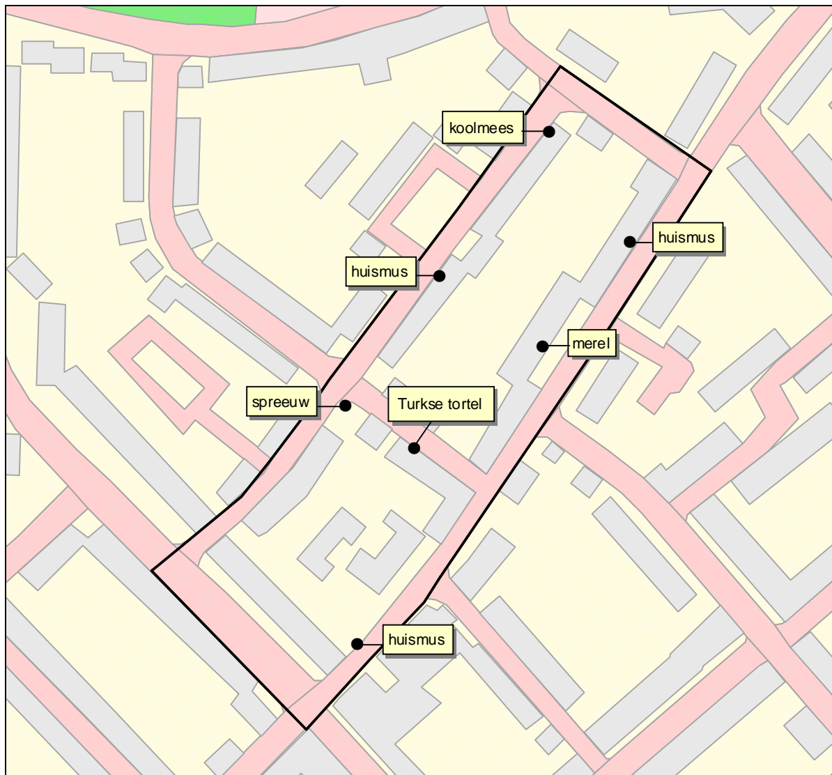
Broedterritoria van vogelsoorten.

Andere beschermde soorten zijn binnen het plangebied in 2009 niet waargenomen.