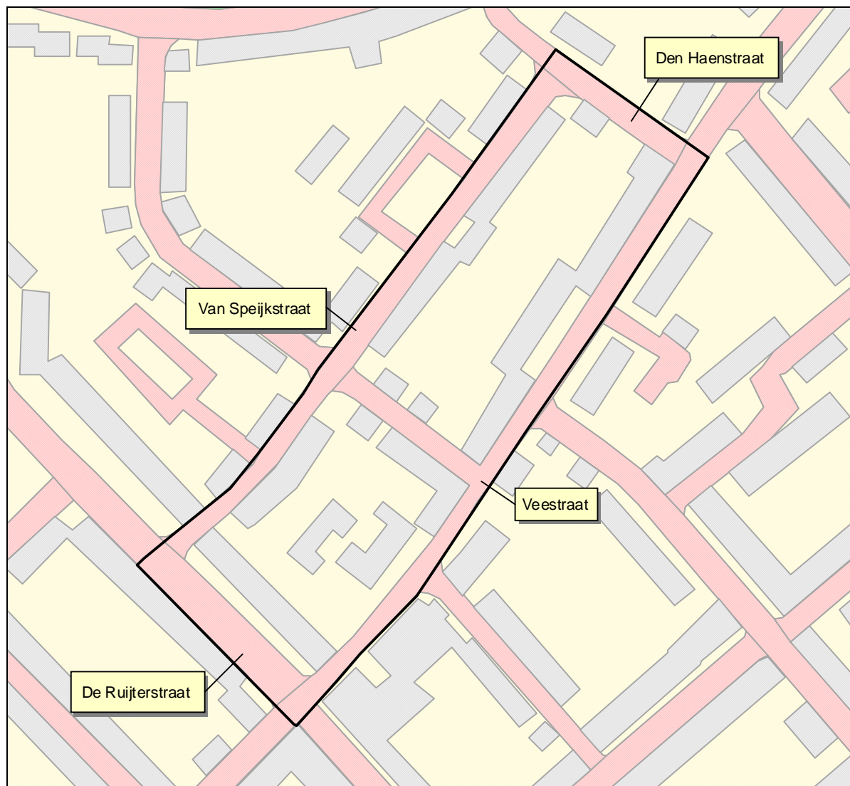
Begrenzing van het onderzoeksgebied.

De gemeente Tilburg is voornemens om het plangebied Zeeheldenbuurt her in te richten. Om meer inzicht te krijgen welke vleermuis- en vogelsoorten momenteel in het gebied voorkomen is door het Ecologisch Adviesbureau Cools in 2009, in opdracht van de gemeente Tilburg, een jaarrondonderzoek uitgevoerd.