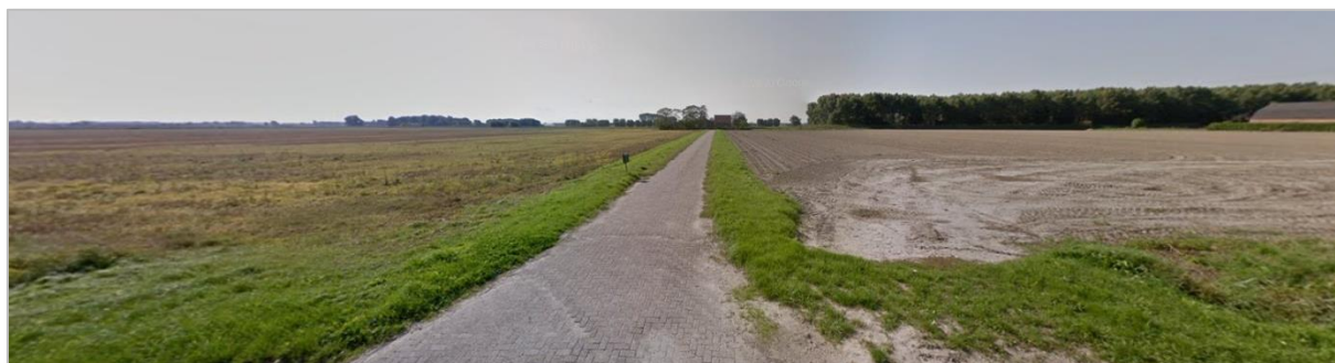
Foto 1: Impressie plangebied, pad naar Boonhil 35 te Steenbergens.