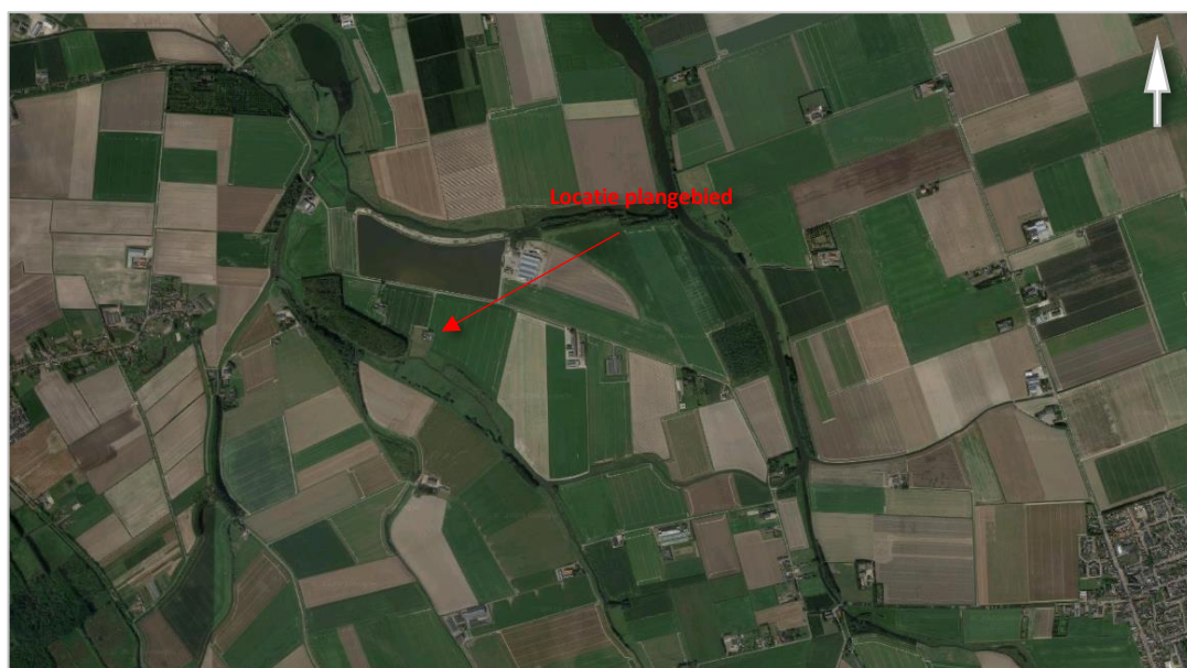
Kaart 2: Luchtfoto locatie plangebied

Kaart 2 toont een globaal overzicht van de locatie van het plangebied in het streekgebied. Kaart 3 toont een meer gedetailleerde beeld van de ligging van het plangebied en de nabije omgeving.