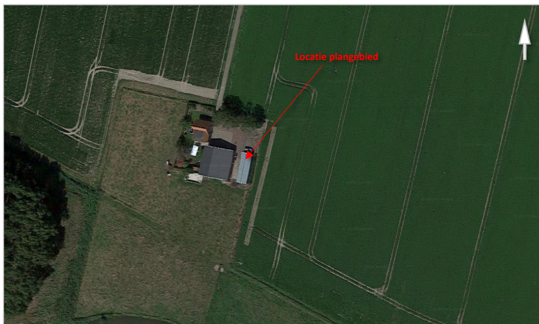
Kaart 3: Detail luchtfoto locatie plangebied