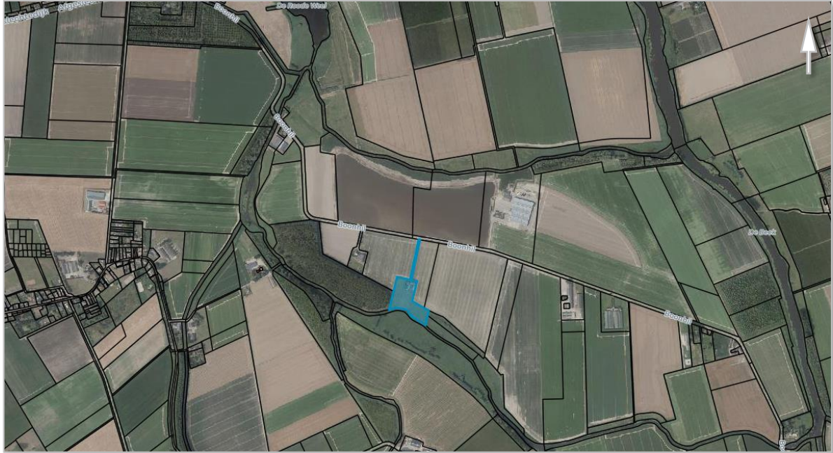
Kaart 1: Kadastrale kaart van het plangebied.