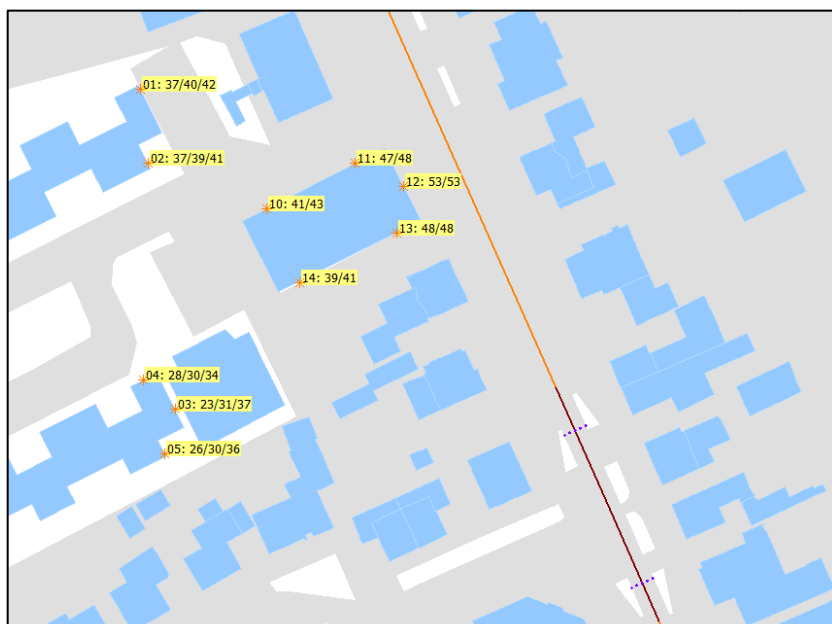
Figuur 5: Geluidbelasting in dB t.g.v de Boerenkamplaan nam aftrek van 5 dB conform artikel 110g Wgh.

De geluidbelasting is bepaald op gevels van de nieuw te bouwen woningen die het dichtst bij de Boerenkamplaan ligt. De geluidbelasting is gegeven inclusief de aftrek van 5 dB conform artikel 110g Wgh. De geluidbelasting ten gevolge van de Boerenkamplaan is in figuur 5 gegeven. De rekenresultaten zijn in detail weergegeven in bijlage D.