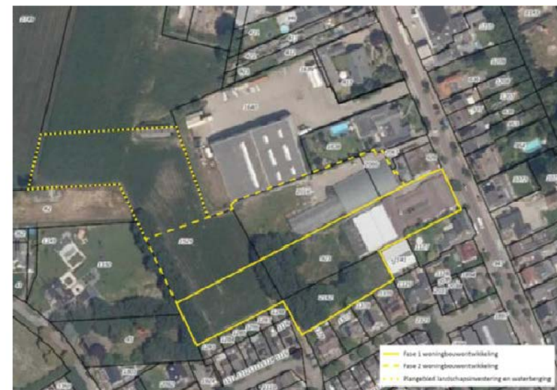
Figuur 2: Luchtfoto van de bouwlocatie.

In figuur 2 is een foto weergegeven met een bovenaanzicht ter plaatse van de bouwlocatie.