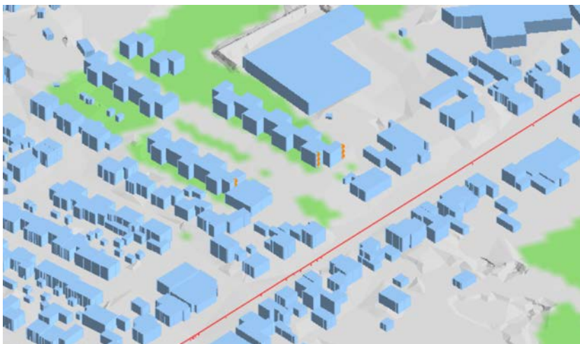
Figuur 4: 3D-impressie van het geluidmodel.