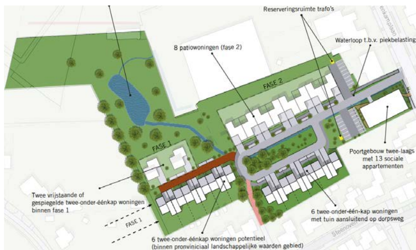
Figuur 3: Overzichtstekening van het bouwplan.

Belangrijk voor de bepaling van de geluidbelasting bij de nieuw te bouwen woning is het wegverkeer op de Boerenkamplaan. Deze weg ligt op circa 50 m van de woningen en 11 meter van het appartementencomplex.