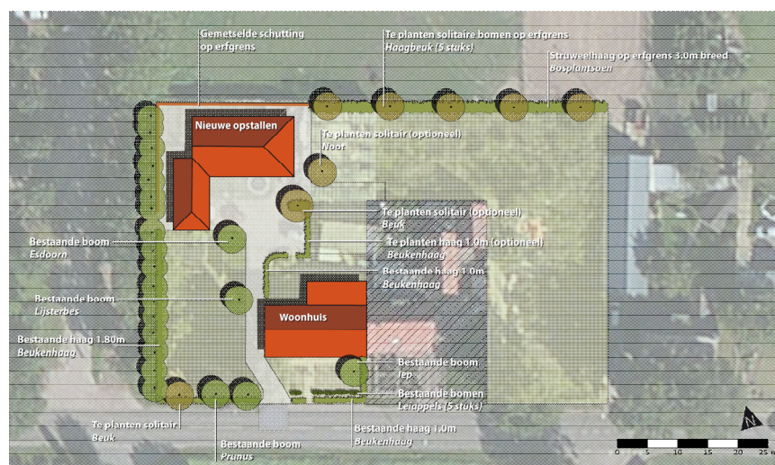
Inrichtingsplan (incl. boom- en plantvakken) Brugstraat 9a Someren 119-005 juni 2015

Het landschapsplan motiveert de gemaakte keuzes voor de inrichting van het plangebied. Voorliggend landschapsplan neemt de uitgangspunten van het beeldkwaliteitplan Buitengebied 2011 van de gemeente Someren als leidraad voor de inrichting en de beplantingssoorten.