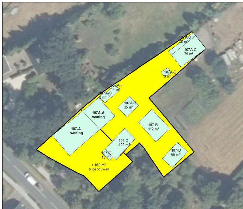
Figuur 6: beeld van bebouwing en bestemmingen aan Boerenkamplaan 107 en 107a

Navolgende figuur geeft een beeld van deze bebouwing en de huidige woonbestemmingen hierbij.