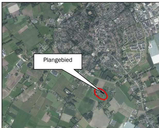
Figuur 1: bovenaanzicht plangebied