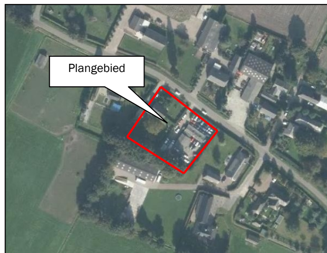
Figuur 2: bovenaanzicht plangebied (pdokviewer)