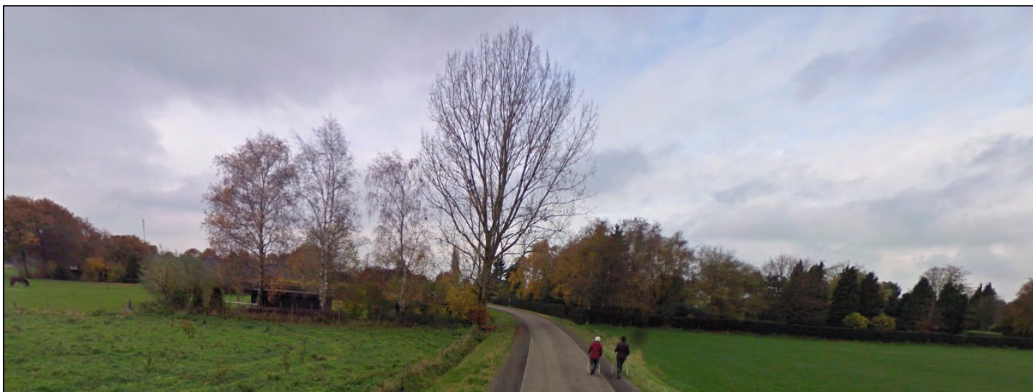
Figuur 3: begin weg Ruiter