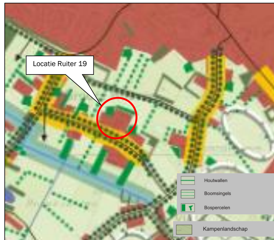
Figuur 1: Uitsnede kaart Beeldkwaliteitsplan