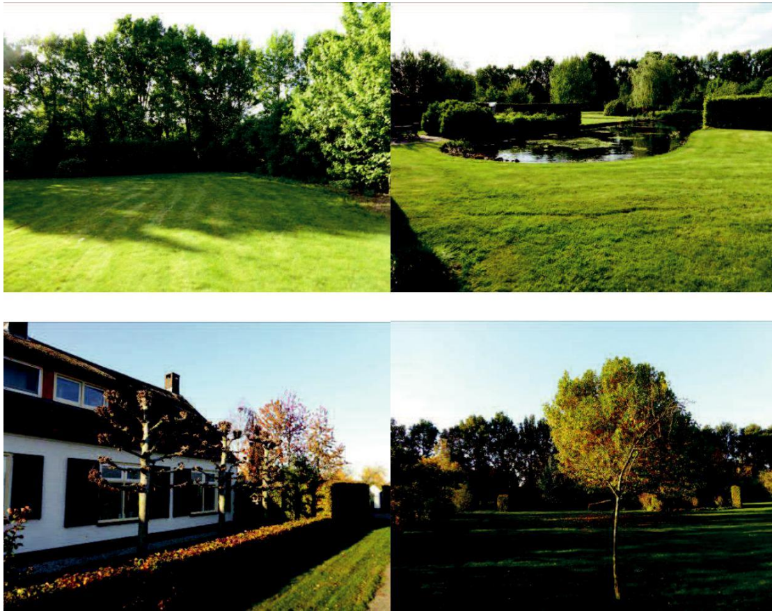
Figuur 16: impressie van de aanwezige landschapselementen op de locatie.

Onderstaand zijn enkele foto's van de beplanting en de poel binnen het plangebied opgenomen.