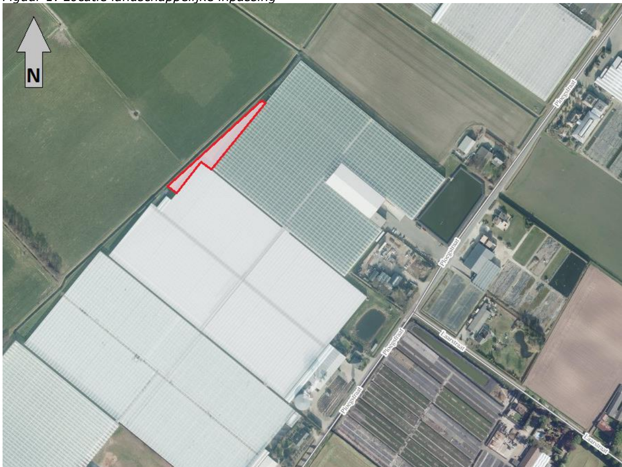
Figuur 1: Locatie landschappelijke inpassing

Deze belangen zorgen ervoor dat de oppervlakte die overblijft voor de landschappelijke inpassing beperkt is. Met dit beplantingsplan wil de ondernemer deze beperkte ruimte invullen ten behoeve van de landschappelijke inpassing van de kassen, zoals als voorwaarde gesteld in de vergunning uit 2007.