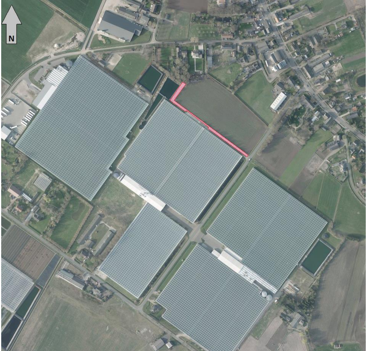
Figuur 1: Locatie landschappelijke inpassing (rood gearceerd)

Op 7 juli 2000 is een vergunning afgegeven voor het oprichten van een tuinbouwkas met bedrijfsgebouw op het perceel plaatselijk bekend als Lavallestraat 4. Als bijlage van deze vergunning was een beplantingsplan bijgevoegd. Gewenst wordt om het beplantingsplan van destijds deels aan te passen. In samenspraak met de gemeente Someren is het voorliggende beplantingsplan opgesteld.