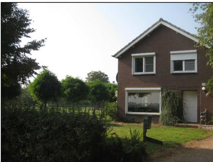
Figuur 18: Landschappelijke inpassing woonhuis met op de voorgrond de haag en op de achtergrond de bolacasia's