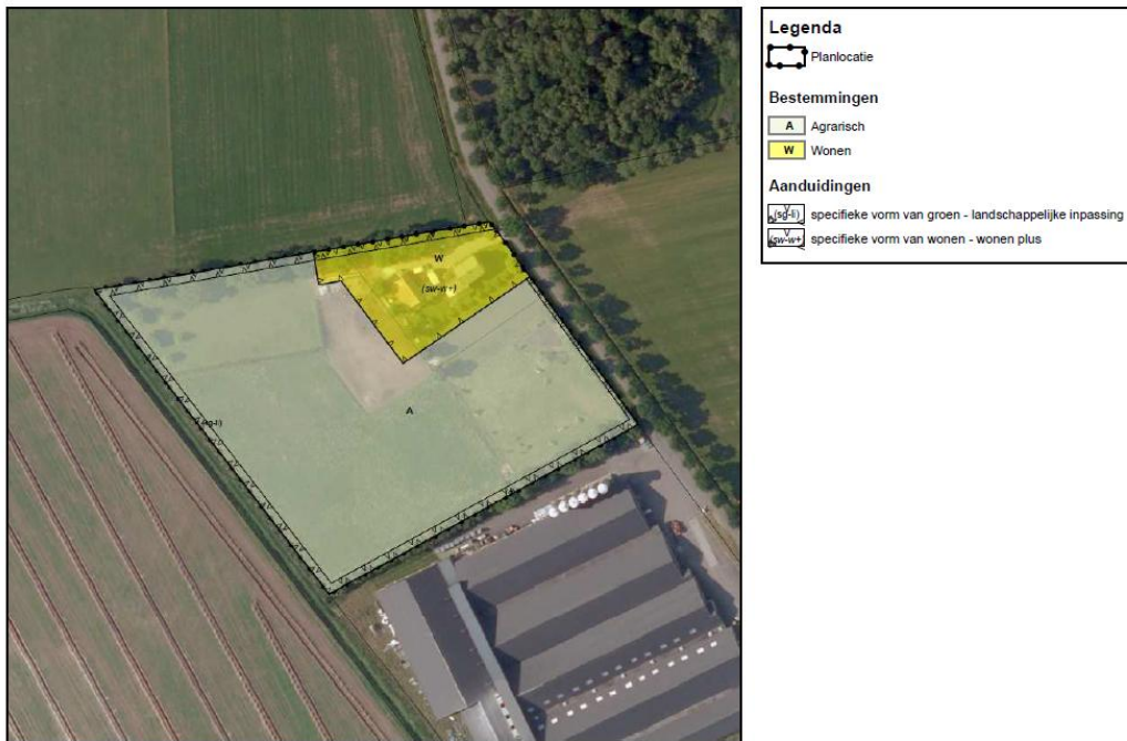
Figuur 19: Beoogde planologische situatie, geprojecteerd op luchtfoto

De landschappelijke inpassing wordt tevens juridisch verankerd middels de aanduiding 'specifieke vorm van groen – landschappelijke inpassing'. Op navolgende figuur is de beoogde planologische situatie weergegeven, geprojecteerd op een luchtfoto.