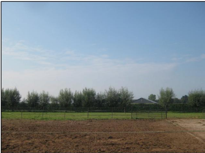
Figuur 16: Knotwilgen ten westen van de planlocatie