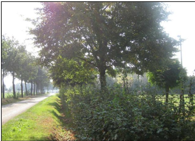
Figuur 17: Haag met veldesdoorn en lindebomen aan straatzijde