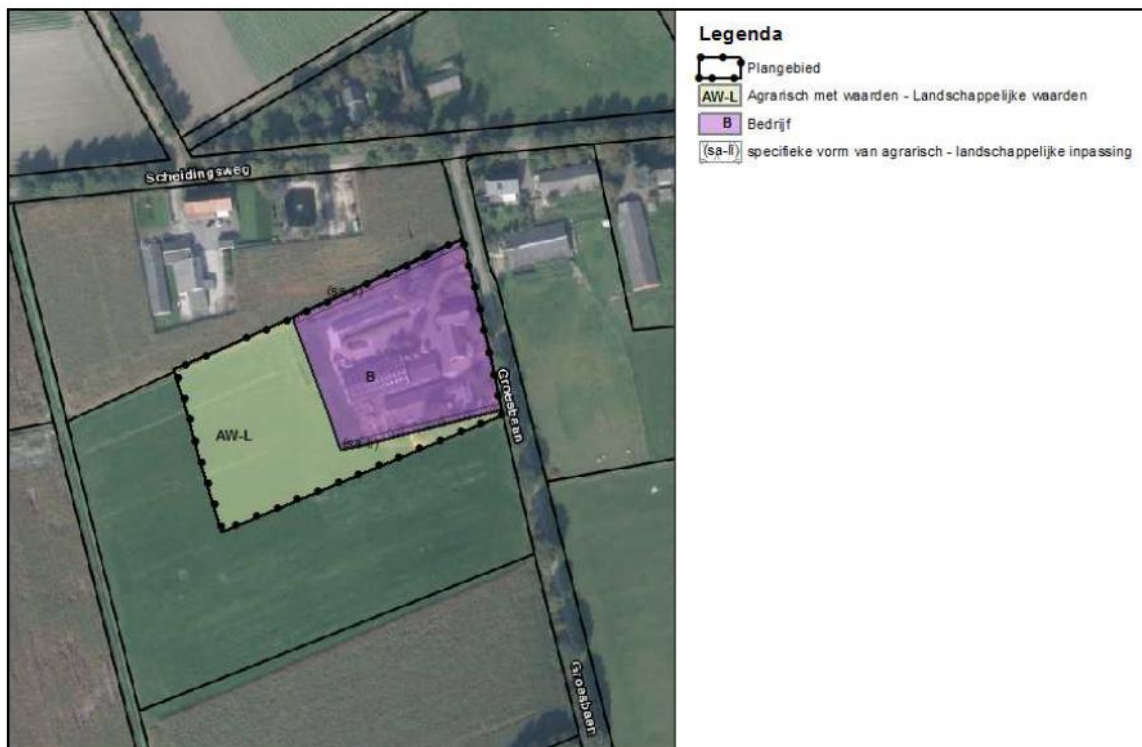
Figuur 9: Beoogde planologische situatie planlocatie