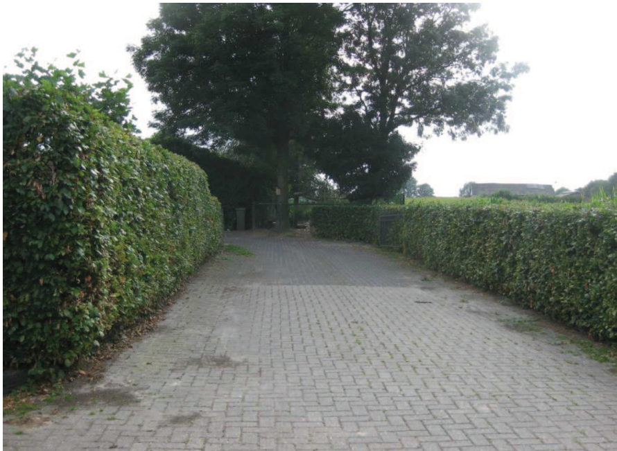
Figuur 12: Landschappelijke inpassing aan de voorzijde van de planlocatie