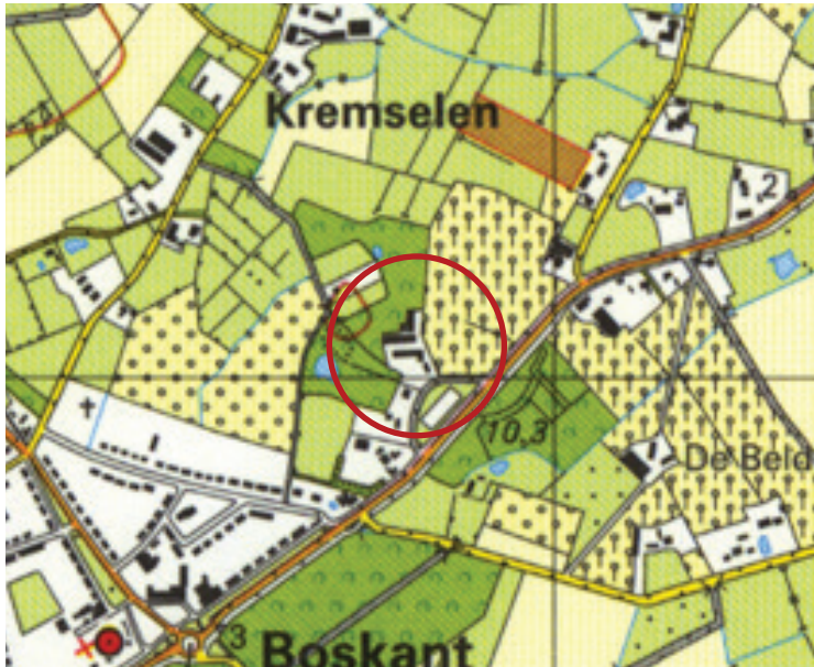
Ligging plangebied (Topografische kaart 2004)