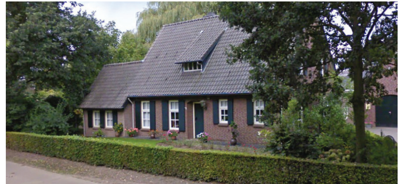
Voorbeeld van een woning in landelijke stijl aan de Oudeweg.