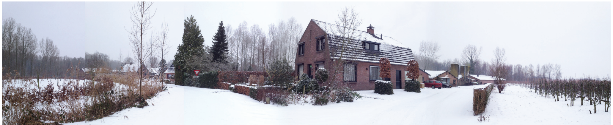
Rommelig beeld door de verschillende beplantingen.