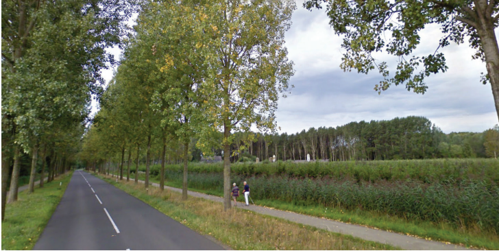
Vanuit de Boskantseweg