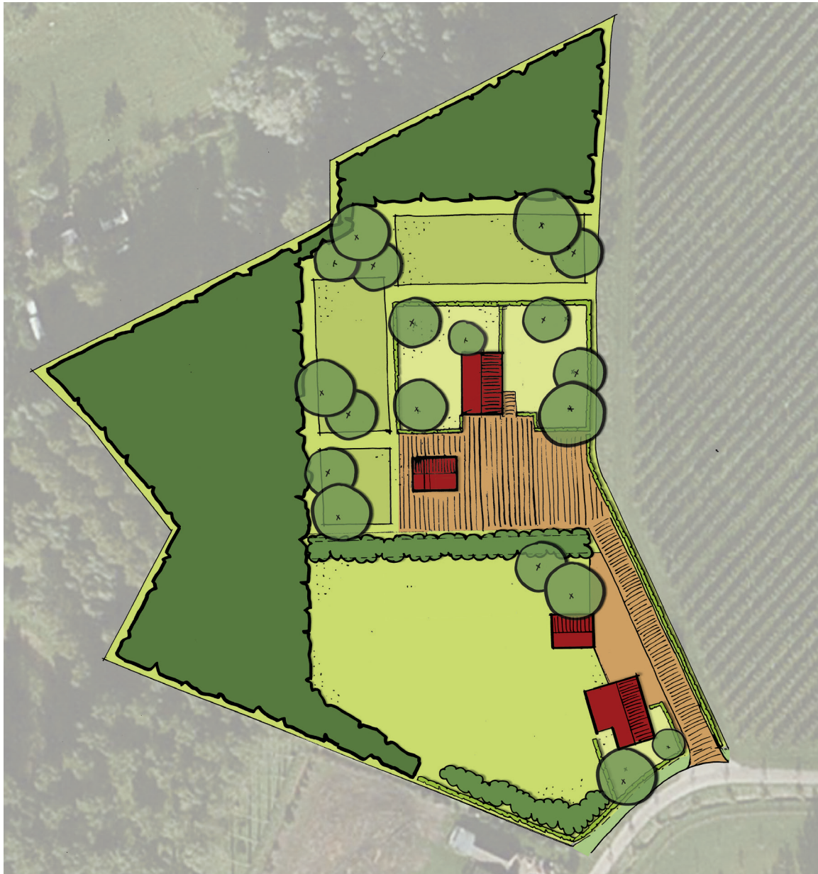
Verkavelingsschets (de getekende inrichting is indicatief op basis van kadastrale gegevens en luchtfoto.)