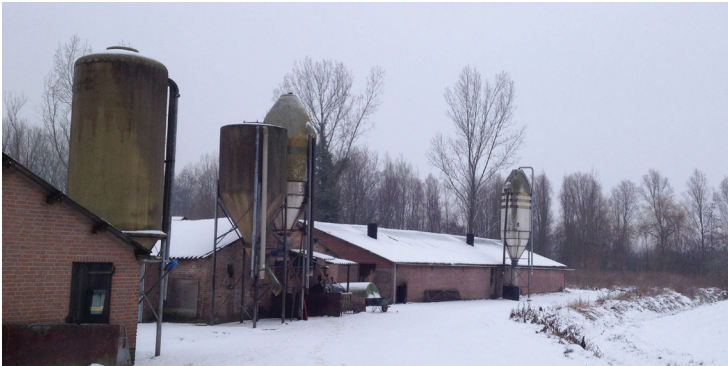
Vanuit de Oudeweg