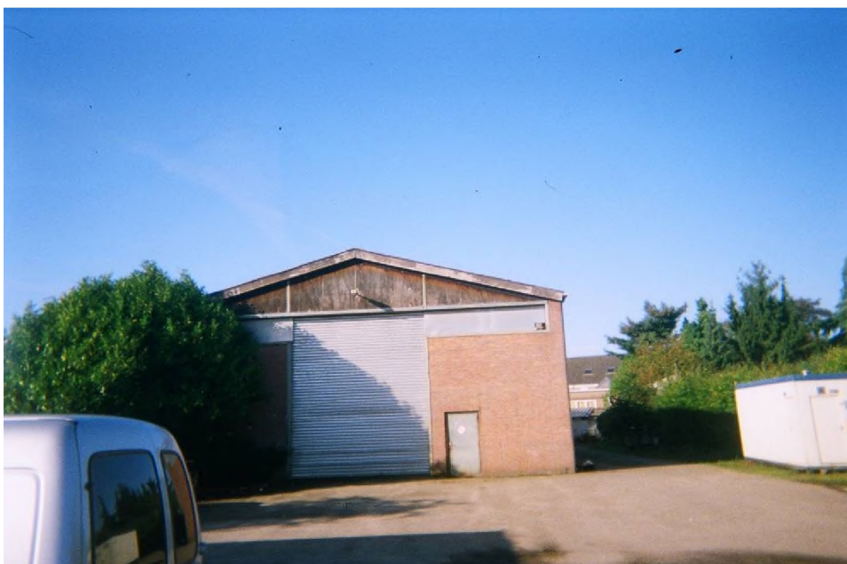
Figuur 1.6 Te slopen bedrijfsbebouwing