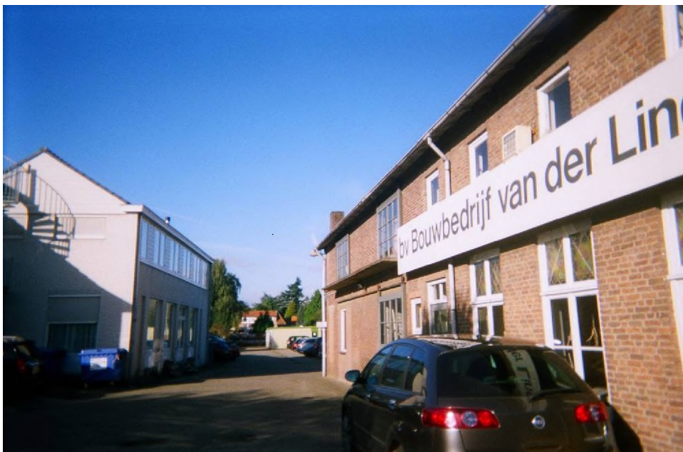
Figuur 1.4 Te slopen bedrijfsbebouwing