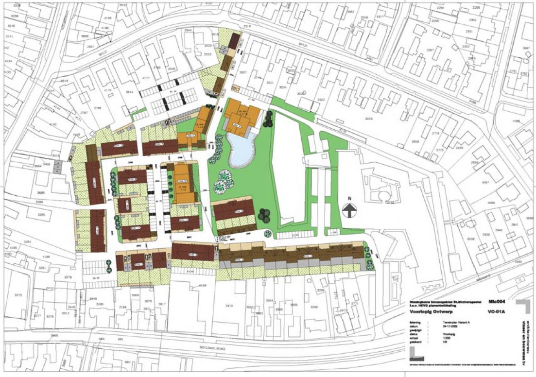
Figuur 1.3 Plan voor het Binnenterrein

In het oostelijke deel van het Binnenterrein vinden geen maatregelen plaats.