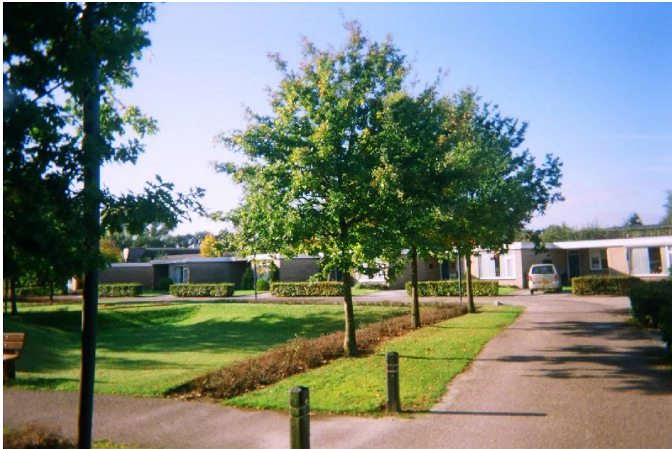
Figuur 1.5 Te slopen bebouwing