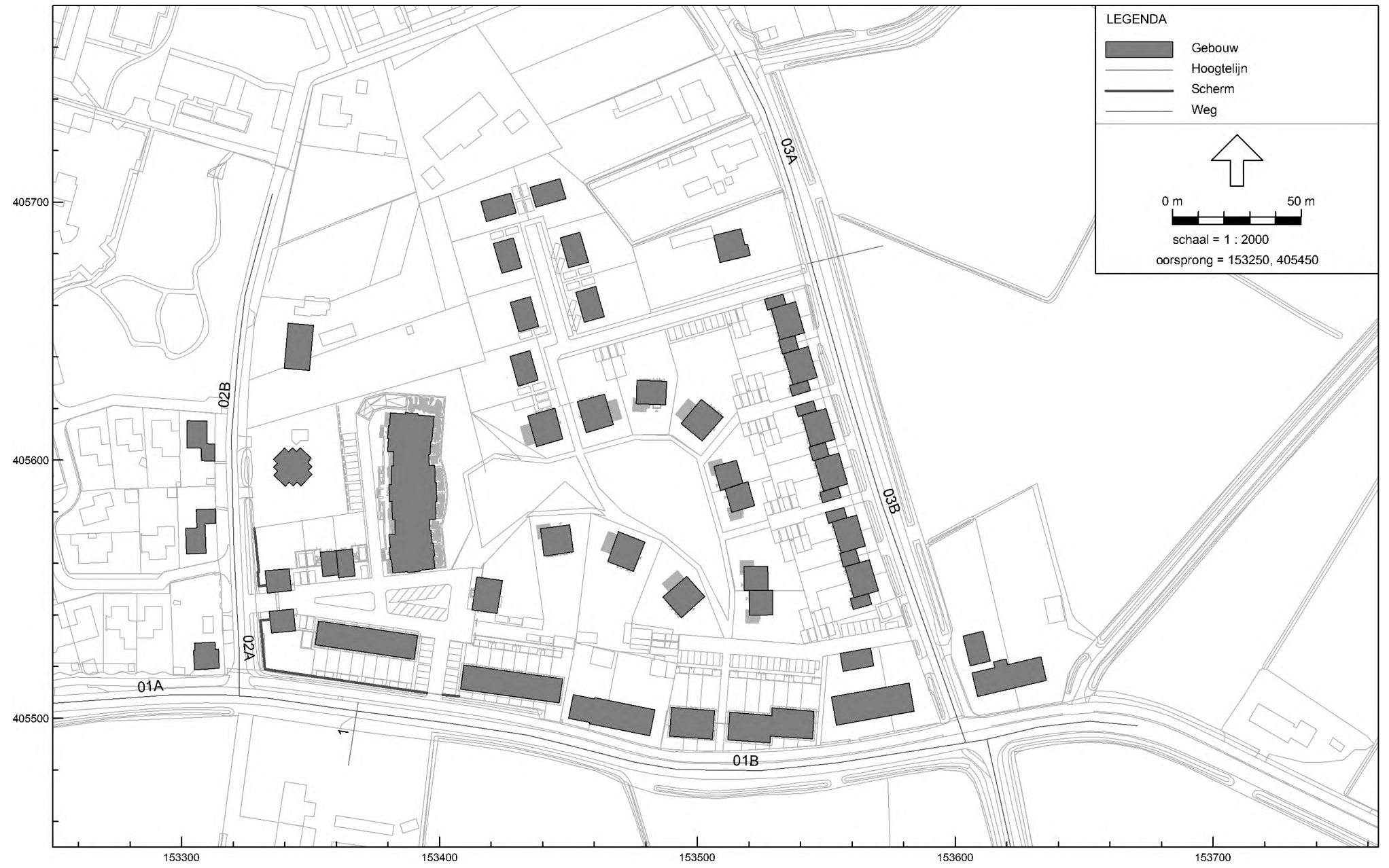
Wegverkeerslawaai - RMW-2006, Gebied - Augustus 2010 - versie van Gebied - Augustus 2010 - Situatie 1, woningen plangebied zonder maatr [O:\Projecten\20100456-00 Schijndelseweg St. Michielsgestel\06\info BRO\downloadlink 2010 08 19\geluidmodel], Geonose V5.43