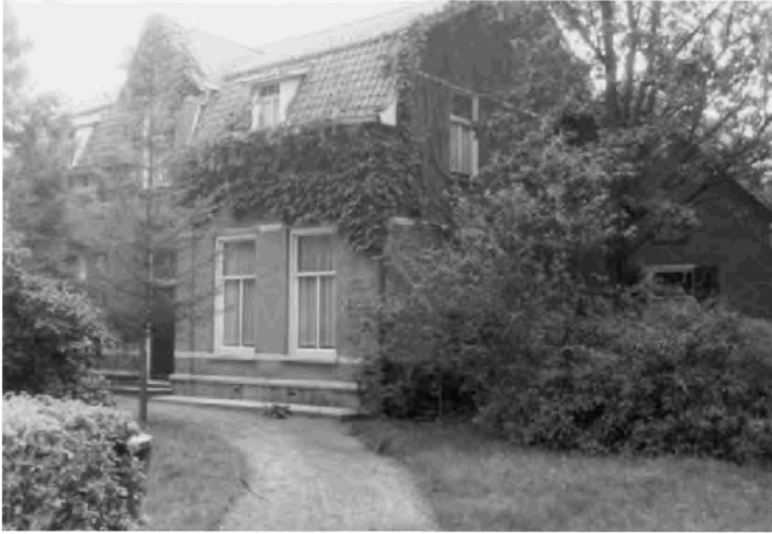
Afbeelding 1: Hoidonk 6, Den