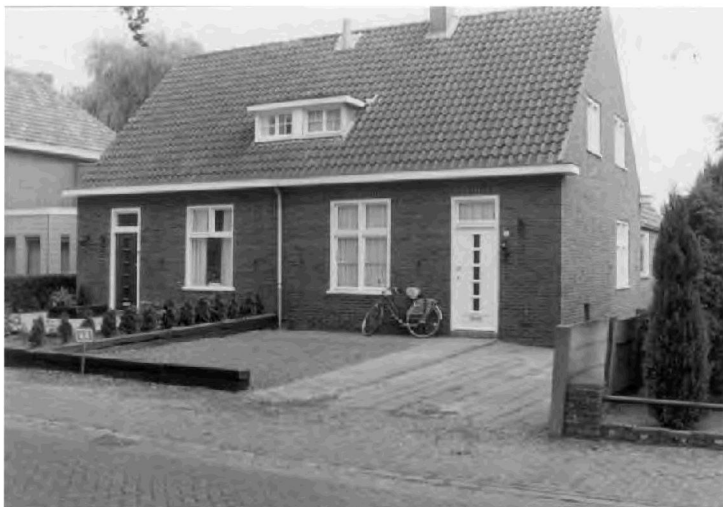
Afbeelding 3: Litsersstraat 76 - 78, Den