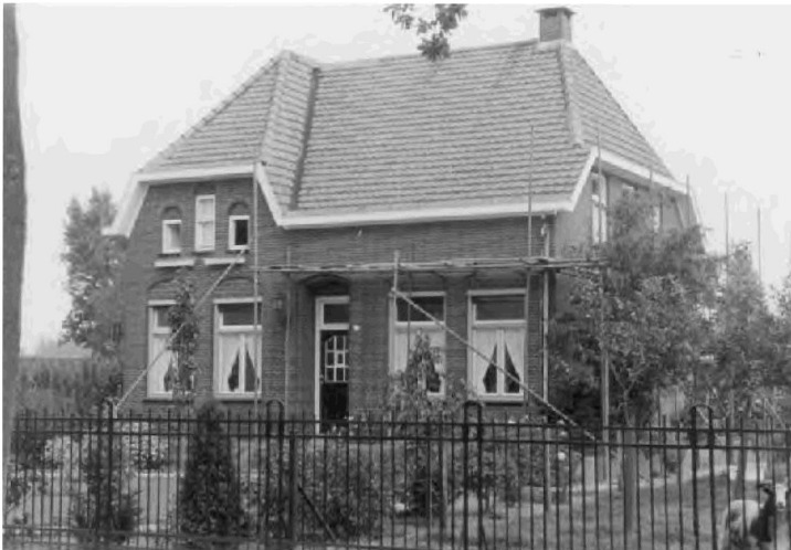
Afbeelding 2: Litsersstraat 62, Den