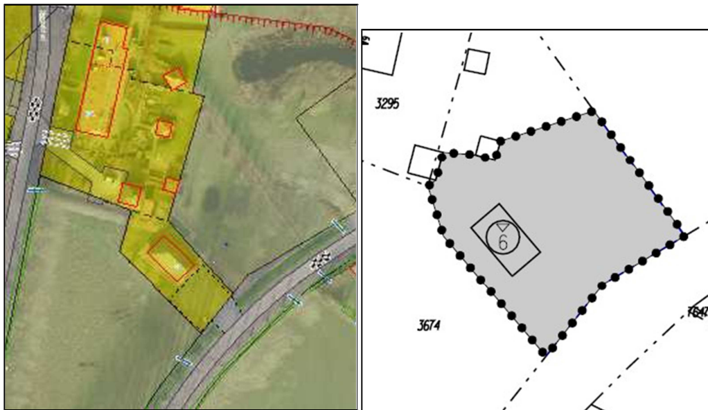
Uitsnede uit projectbesluit