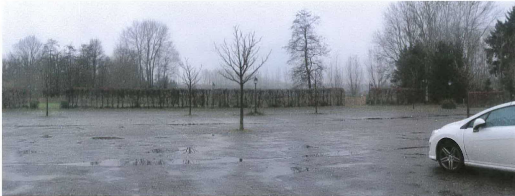
verhard parkeerterrein & beperkt uitzicht op achterliggend landschap door hoge beukenhaag