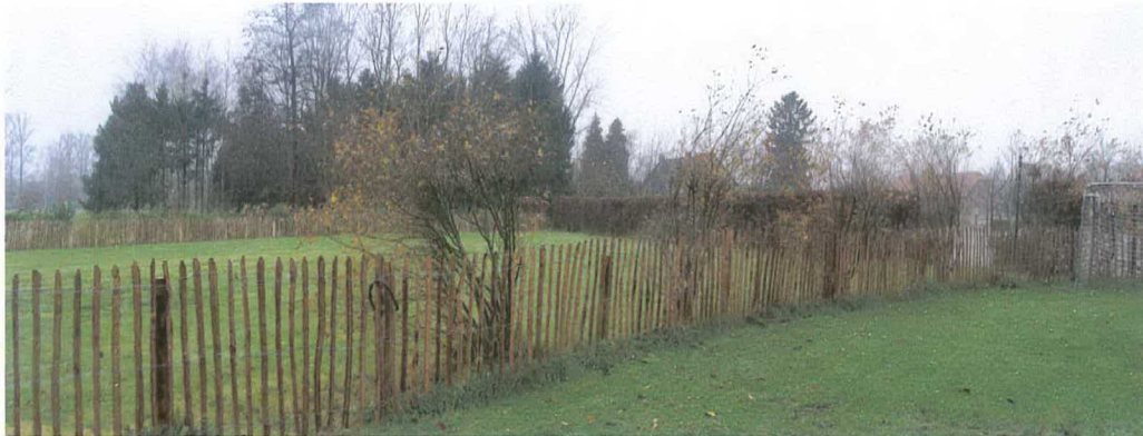
lokatie toekomstige midgetgolfbaan