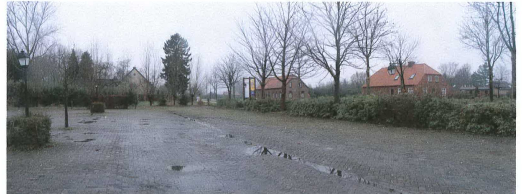
rand met cultureelrijke beplanting tussen parkeerterrein en Boxtelseweg