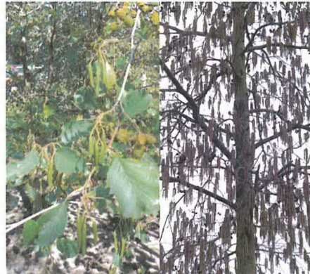
Alnus glutinosa (zomer- & winterbeeld)