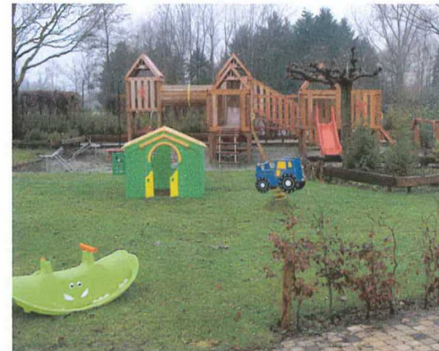
tuin met speelvoorzieningen