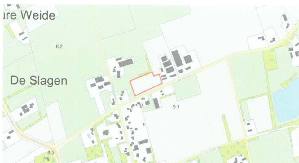
Figuur 1 Ligging van het plangebied.

Het plangebied wordt aan de noordzijde gedeeltelijk begrensd door een houtsingel, aan de zuidzijde door de Bernhardstraat met daarlangs een bomenrij van lindebomen ( Tilia spec. ), aan de oostzijde door een agrarisch bedrijfsperceel en aan de westzijde door een agrarisch perceel.