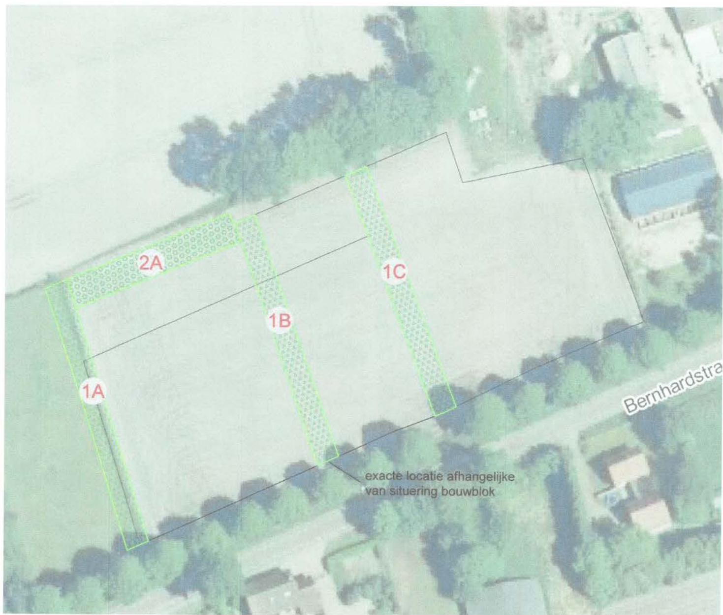
Figuur 2 Beplantingsplan behorende bij plantlijst paragraaf 4.1