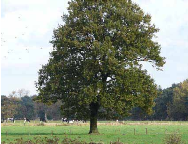
Landschapsboom als Solitaire