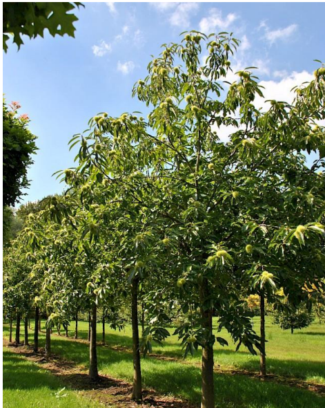
Figuur 11: Wilde kastanje