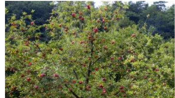
Figuur 8: laagstamfruitboom