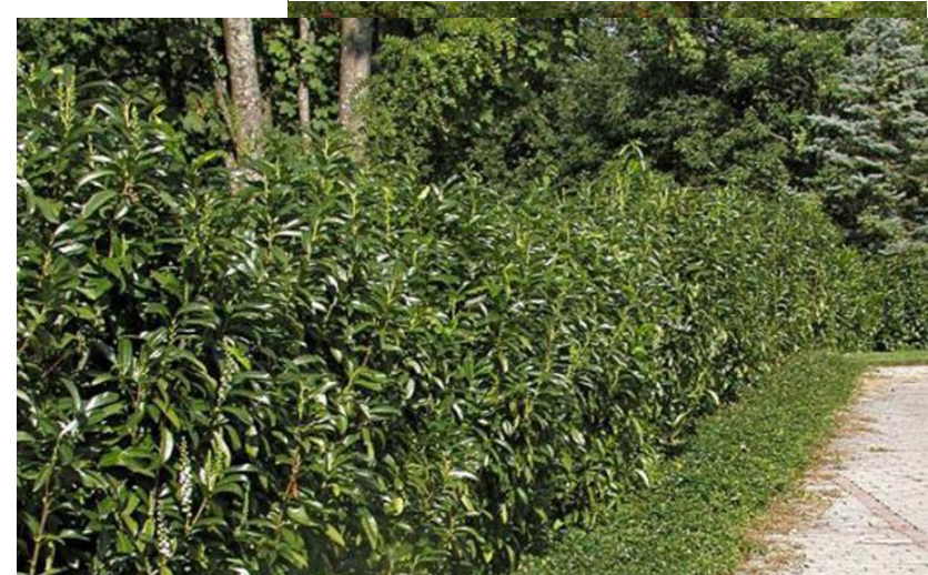
Figuur 9: Laurierhaag