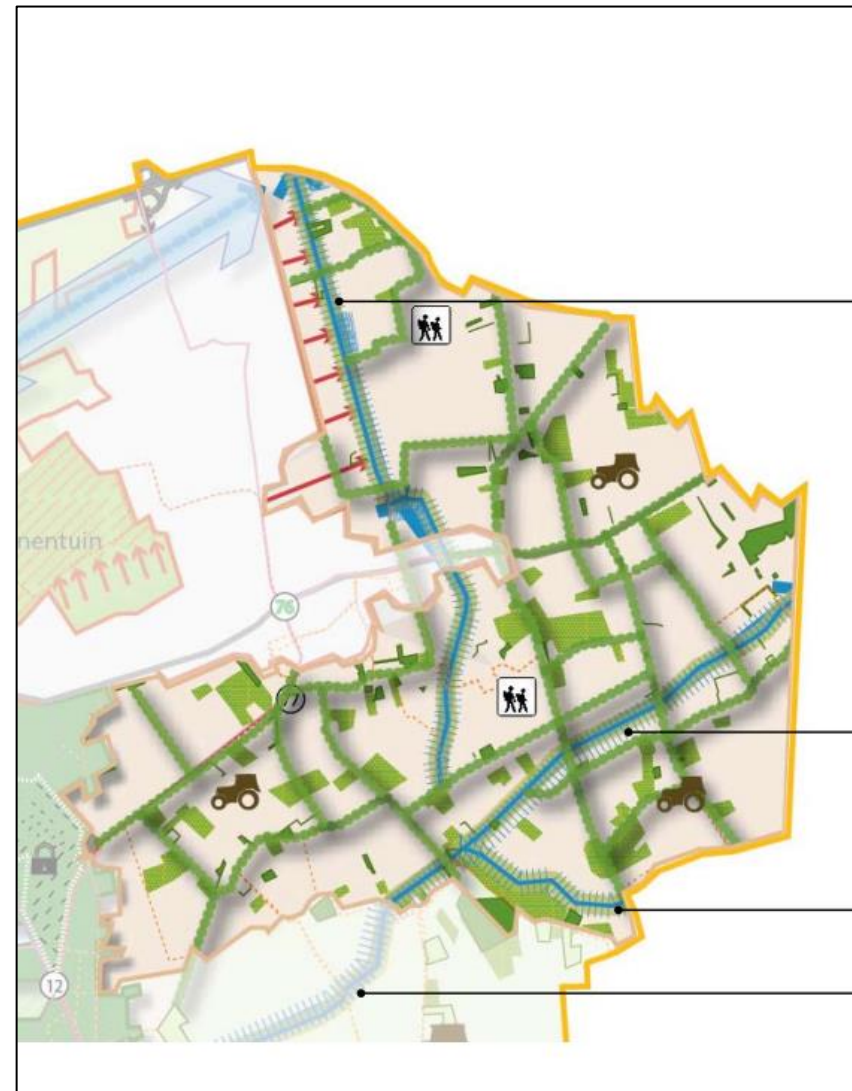
Figuur 4: LOP-gebied Het Oosten

Verder heeft de gemeente een groene kaart. Op deze kaart staan alle houtopstanden in de gemeente, zowel particuliere als openbare houtopstanden (zie figuur 4). Op de locatie staan geen houtopstanden die als gevolg van het initiatief beschadigd worden.