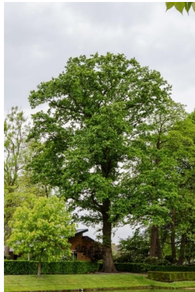
Figuur 10: Zomereik