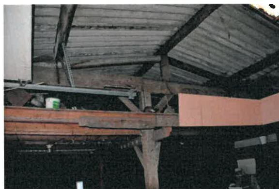
Gedeeltelijke houtconstructie in de stal links van de schuur.