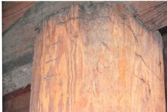
Stijl met telmerk III.

zich nog een loshangende schoor zonder stijl, maar met opening voor een stijl in de balk.