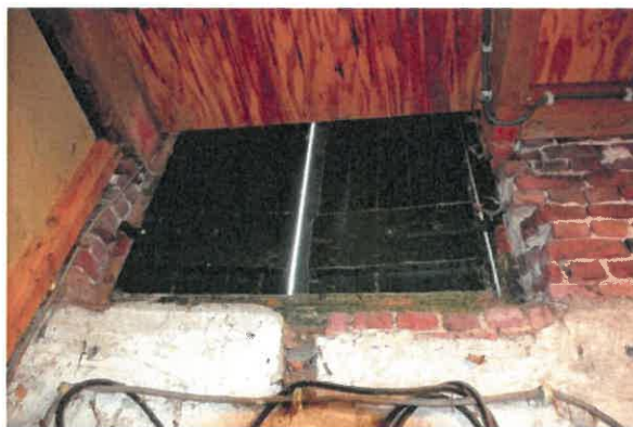
Hooiluik vanaf de binnenzijde gezien.

Het eerste gebint (vanaf de deeldeuren gezien) heeft nog één schoor. Zowel de stijl als de schoor zijn voorzien van een gehakt telmerk III. Aan de dikte en verschillende openingen te zien is de moerbalk geen echte moerbalk, maar een hergebruikt onderdeel. Ook lijkt de stijl recht te zijn afgezaagd. Wel is de balk op twee plaatsen voorzien van een gehakt telmerk III. Ter hoogte van de houten achtergevel van de schuur bevindt