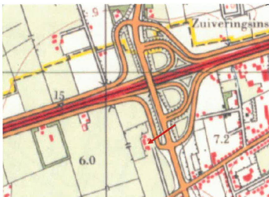
Topografische kaart, 1980. De nieuwe situatie met de aanleg van het viaduct en knooppunt. De rode pijl markeert de locatie van de schuur.

De oorspronkelijke langsdeelschuur is gebouwd vanuit een rechthoekige plattegrond. De schuur telt een bouwlaag en een kap en heeft een zadeldak met wolfseinden. Het dak is overwegend gedekt met gesmoorde muldenpannen, aangevuld met rode muldenpannen. De schuur is opgetrokken in schoon metselwerk van rode baksteen, gemetseld in kruisverband en met een oorspronkelijk kalkhoudende voeg.