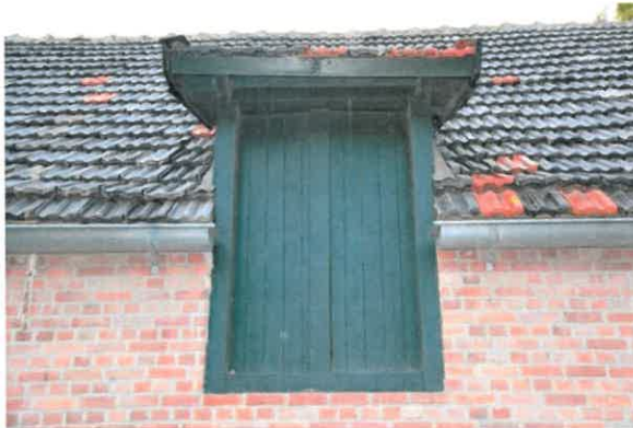
Hooiluik. De dagkanten tonen sporen van verbreding van de gevelopening.