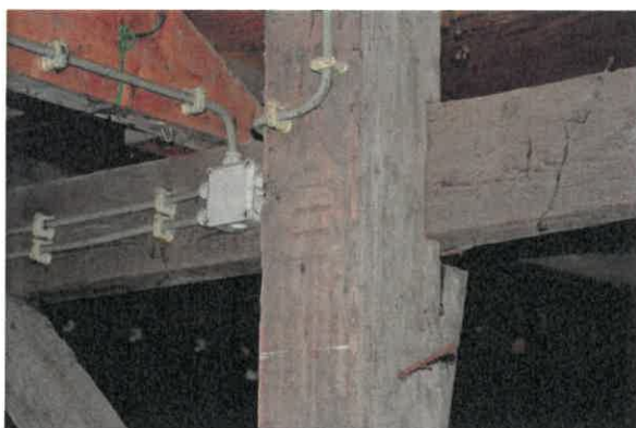
Detail gebintstijl met telmerk IIII.