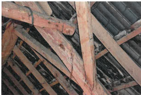
Detail verbinding spant met gordingen.