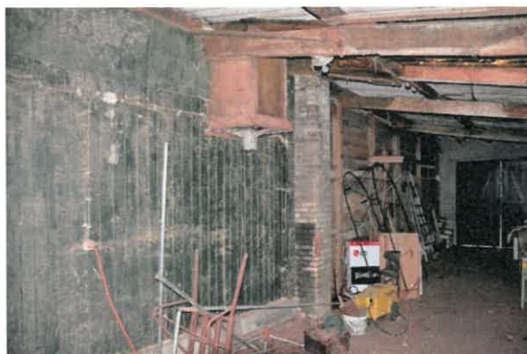
Voormalige achtergevel van de schuur, nu bestaande uit houten delen.