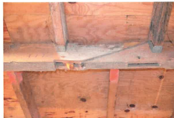
Moerbalk met sporen van hergebruik en telmerk III.