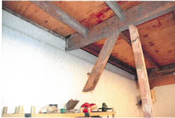
Niet functionele schoor t.h.v. de achtergevel.

Het tweede gebint heeft twee schoren, maar van verschillende lengte en verschillende openingen waar ook schoren gezeten zouden kunnen hebben. Op de stijl en korte schoor zijn de gegutst telmerken II aangetroffen. Ook hier uiterst links in de moerbalk een schoor. Ook deze moerbalk lijkt eerder een andere functie te hebben gehad en ook hier lijkt de gebintstijl te zijn afgezaagd.