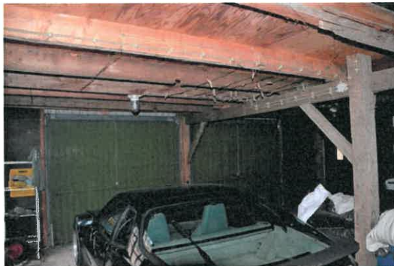
Gedeeltelijke houtconstructie in de stal links van de schuur.

Noemenswaardig is de gedeeltelijke houtconstructie in het staldeel links van de hierboven beschreven schuur. Daar rust de kapconstructie op twee standvinken, waarvan een standvink met een gegutst telmerk IIII. Ook deze stijlen zijn verbonden met gebintkoppelbalk met schoren en is ter plaatse van de garagedeur afgezaagd.