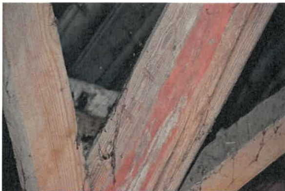
Detail spant met telmerk II in het spantbeen.