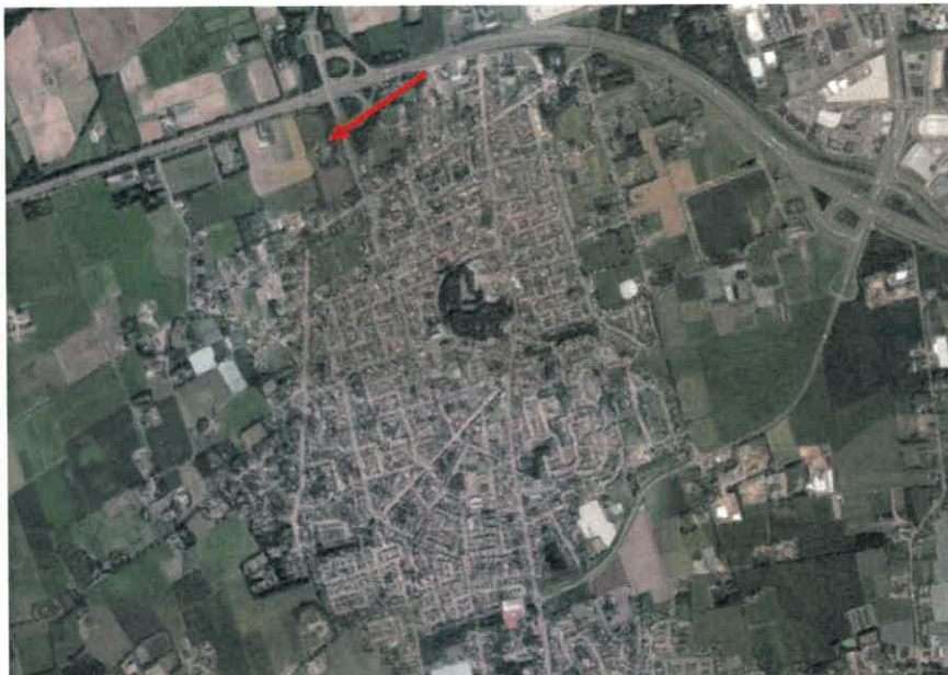
Luchtfoto van Sint Willebrord en omgeving. De rode pijl markeert de locatie van de boerderij.

Dit rapport heeft als doel de cultuurhistorische waarden van de schuur in beeld te brengen. De aangebouwde stallen zijn niet van cultuurhistorische waarde en zullen daarom niet in de beschrijving worden opgenomen.