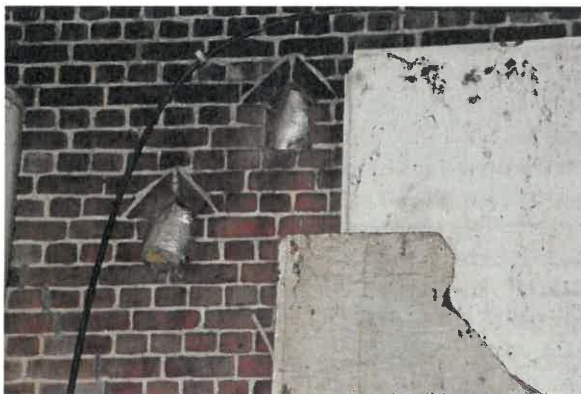
Openingen met keperboog in het metselwerk.