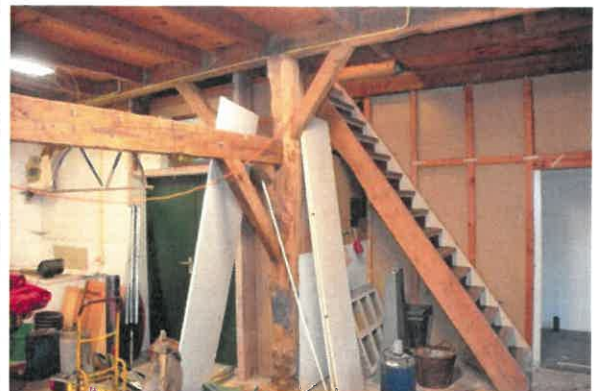
Links: detail gebintstijl met schoren en gebintkoppelbalk. Rechts: gebint met telmerk II.