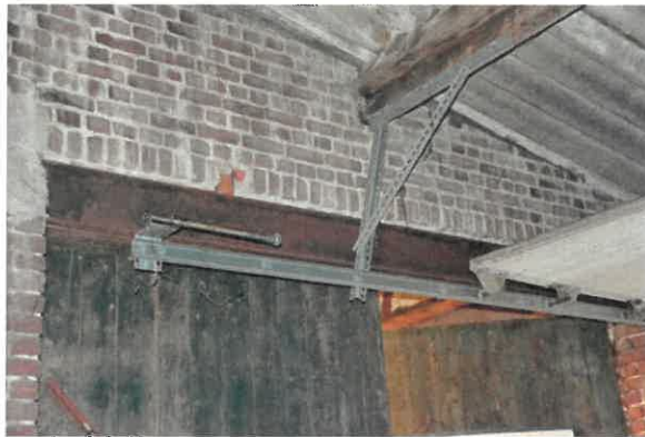
Detail deeldeuren met stalen latei.