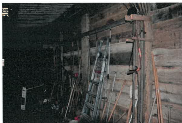
Detail voormalige achtergevel.