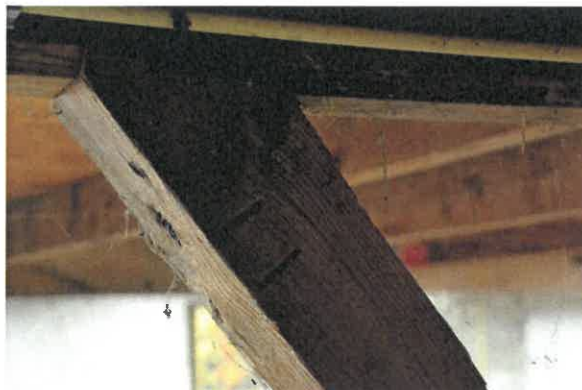
Schoor met gegutst telmerk II.