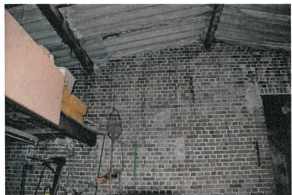
Metselwerk linker zijgevel.