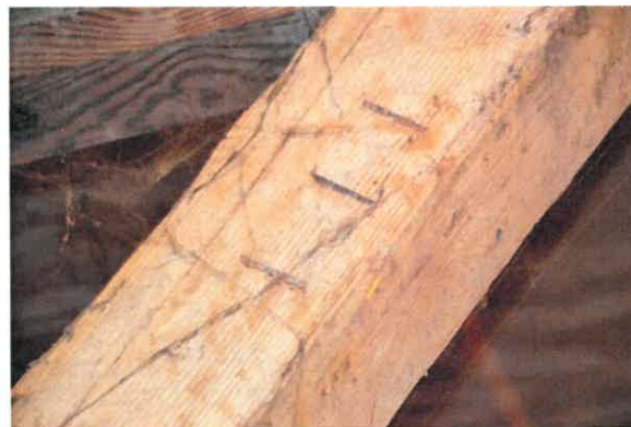
Schoor met telmerk III.