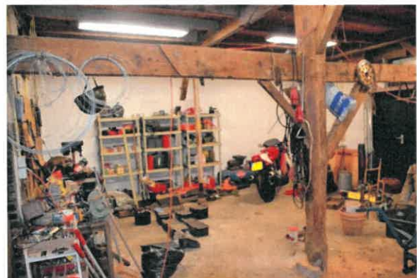
Links: standvink met gebintkoppelbalk. Rechts: het voorste gedeelte van de schuur naar de achtergevel gezien.