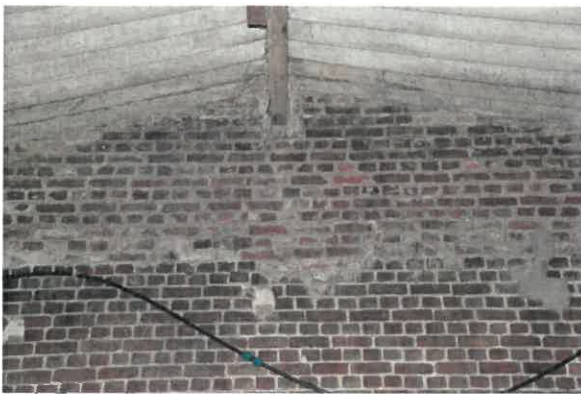
Detail rechterzijgevel met oud metselwerk onder en vernieuwd metselwerk boven.