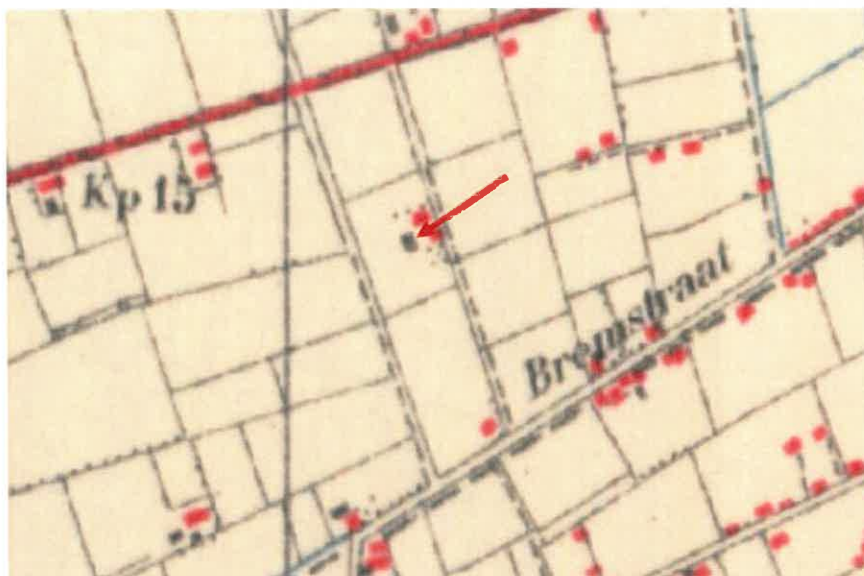
Uitsnede van de topografische kaart uit 1937. De rode pijl markeert de locatie van het boerderijcomplex met agrarische schuur.