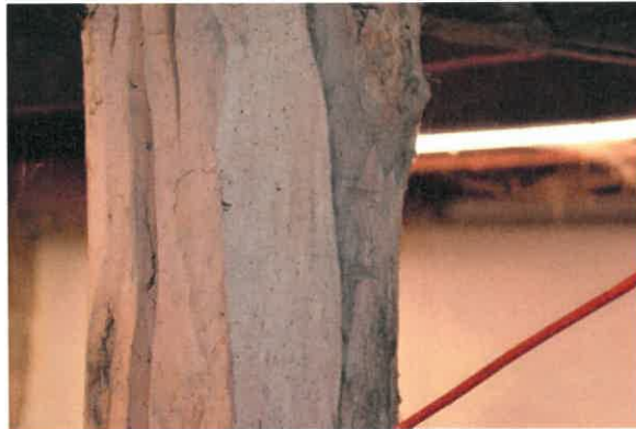
Stijl met gegutst telmerk II.

Van het derde gebint is alleen de stijl zichtbaar in een van de later aangebrachte kamers. Ook deze stijl heeft ongelijke schoren. Hierop zijn geen zichtbare telmerken aangetroffen.