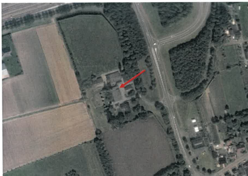
Luchtfoto van de Roosendaalseweg 33 en omgeving. De rode pijl markeert de locatie van de boerderij.