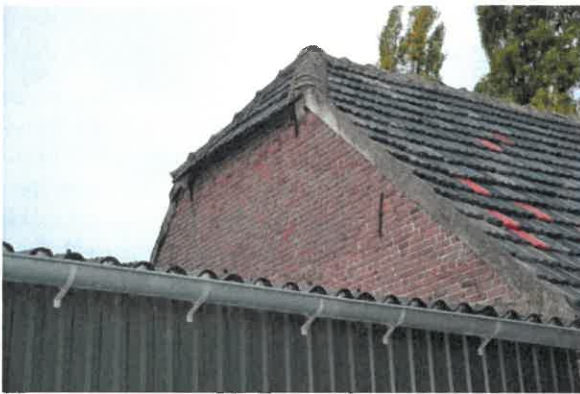
Linkerzijgevel vanaf buiten gezien.