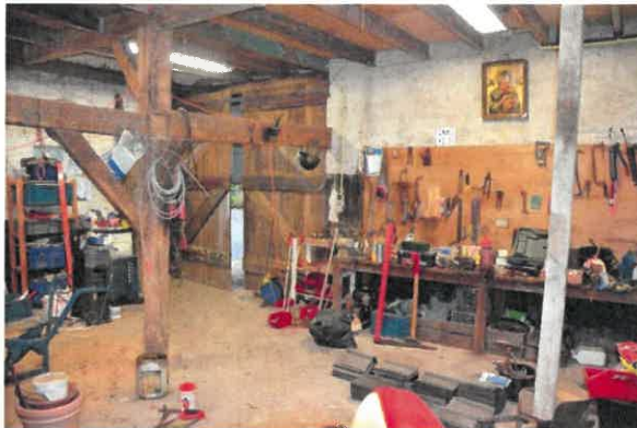
Het voorste gedeelte van de schuur naar de voorgevel/ linkerzijgevel gezien.