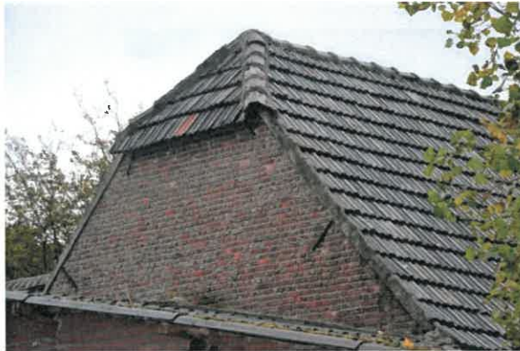
De rechterzijgevel vanaf buiten gezien.