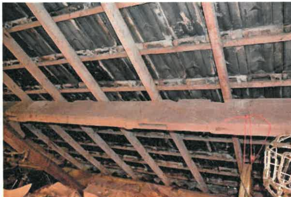
Detail gording met sporen van hergebruik.

Noemenswaardig is de gedeeltelijke houtconstructie in het staldeel links van de hierboven beschreven schuur. Daar rust de kapconstructie op twee standvinken, waarvan een standvink met een gegutst telmerk IIII. Ook deze stijlen zijn verbonden met gebintkoppelbalk met schoren en is ter plaatse van de garagedeur afgezaagd.