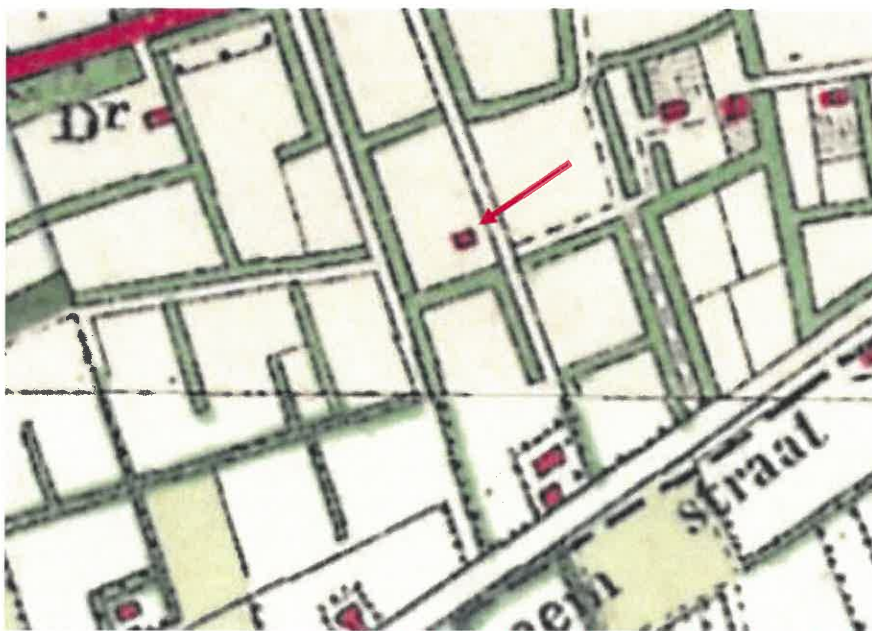
Uitsnede van historisch topografische kaart, 1911. De rode pijl markeert de locatie van de boerderij Roosendaalseweg 33.