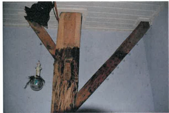
Links: derde standvink in een van de later aangebrachte ruimtes. Rechts: detail standvink met ongelijke schoren.

De kap is een sporenkap en bestaat uit drie rondhouten A-spanten. Voor de gordingen zijn houten balken van elders hergebruikt. De rondhouten spantdelen zijn door middel van spijkers met elkaar verbonden. De spanten hebben rechtgezaagde schoren, die eveneens met spijkers zijn bevestigd. Sporen en pannenlatten zijn vernieuwd. Op het middelste spant is een gegutst telmerk II aangetroffen.