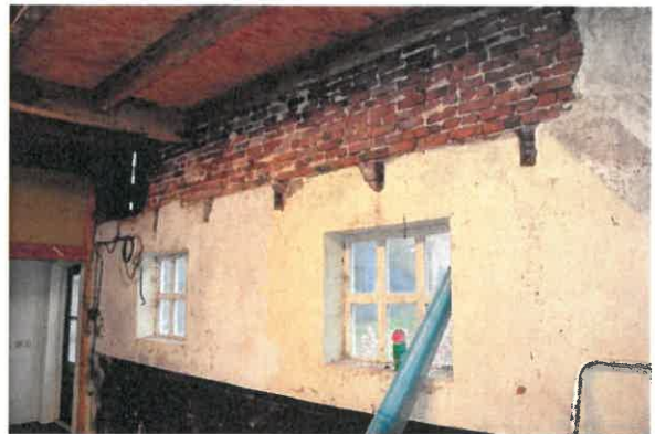
Links: steektrap naar de kapverdieping. Rechts: balkgaten in de voorgevel.