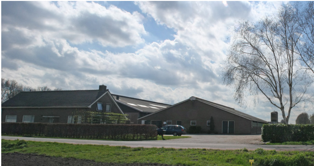
Zicht vanuit noord op het woonhuis en de melkveestallen