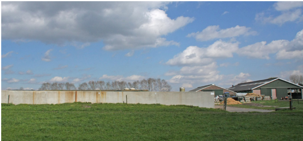
Zicht op achterzijde/zuidzijde perceel