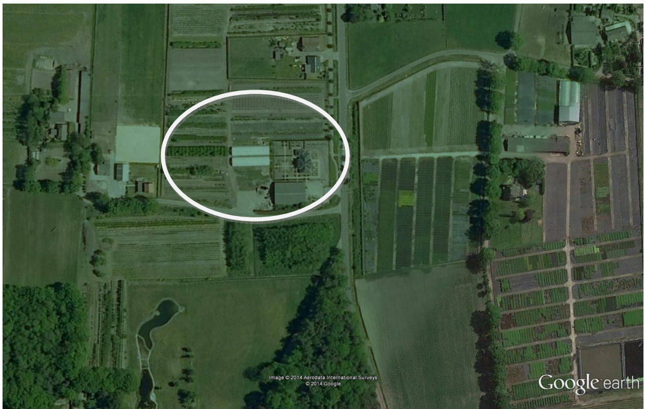
Locatie Boomkwekerij Ludo van Overveld

Categorie 1. Ruimtelijke ontwikkelingen met nauwelijks tot geen landschappelijke invloed en waarbij geen (extra) kwaliteitsverbetering van het landschap wordt geëist.