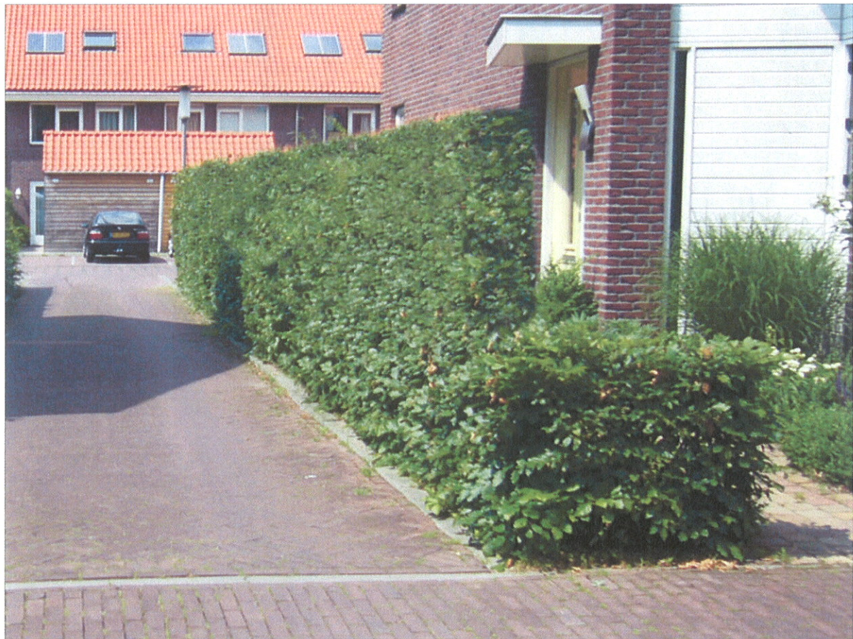
Haag van Fagus sylvatica (beuk)

Erfafscheidingen die een meter achter de voorgevelrooilijn staan en grenzen aan het openbaar gebied kunnen bestaan uit haag van Fagus sylvatica (beuk). Als kleuraccent wordt er af en toe een rode beuk ( Fagus sylvatica `Purpurea`) toegevoegd, mengverhouding 1:25. De beheerhoogte van de haag mag maximaal 2 meter bedragen. Voor een fysieke afscheiding van het perceel mag er achter de haag (binnenzijde perceel) een hekwerk geplaatst worden.