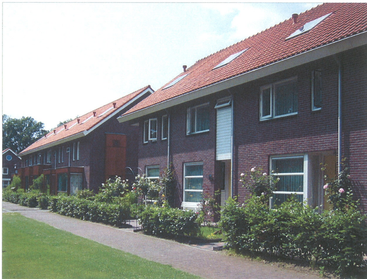
Haag van Fagus sylvatica (beuk)

In de beukenhaag wordt een geleidehek/voethek geplaatst met een hoogte van 70 cm. Dit hekwerk beschermt de haag en geeft tevens de beheerhoogte aan.