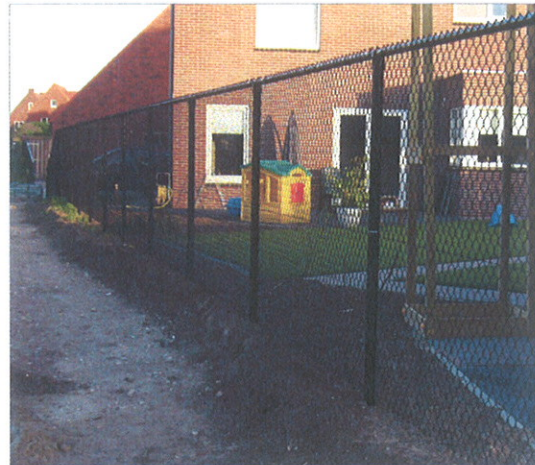
Toe te passen hekwerk

De maximale hoogte van het hekwerk is 2 meter.