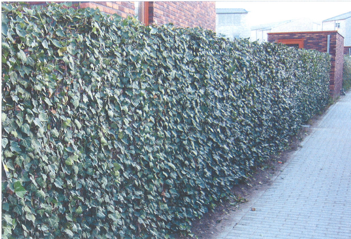
Hekwerk begroeid met Hedera helix