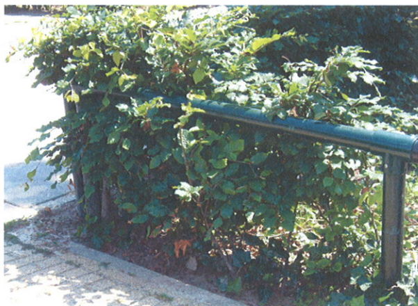
Geleidehek/voethek in haag