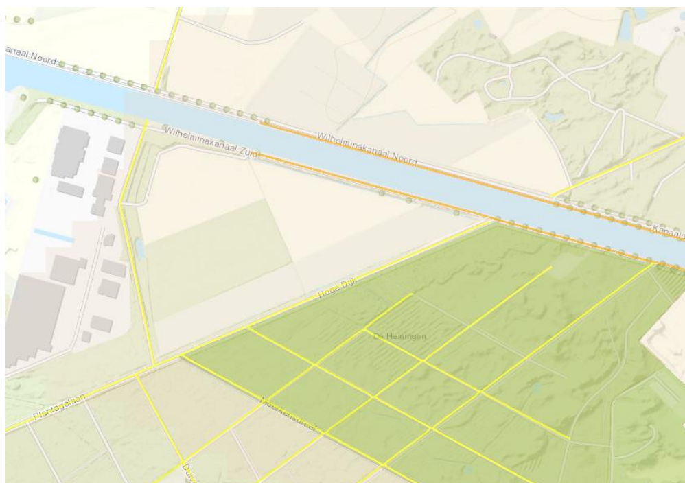
Figuur 3: Provinciale cultuurhistorische waarden

De provinciale cultuurhistorische waardenkaart geeft enkele historisch geografische waardevolle structuren in de directe omgeving van het plangebied aan.