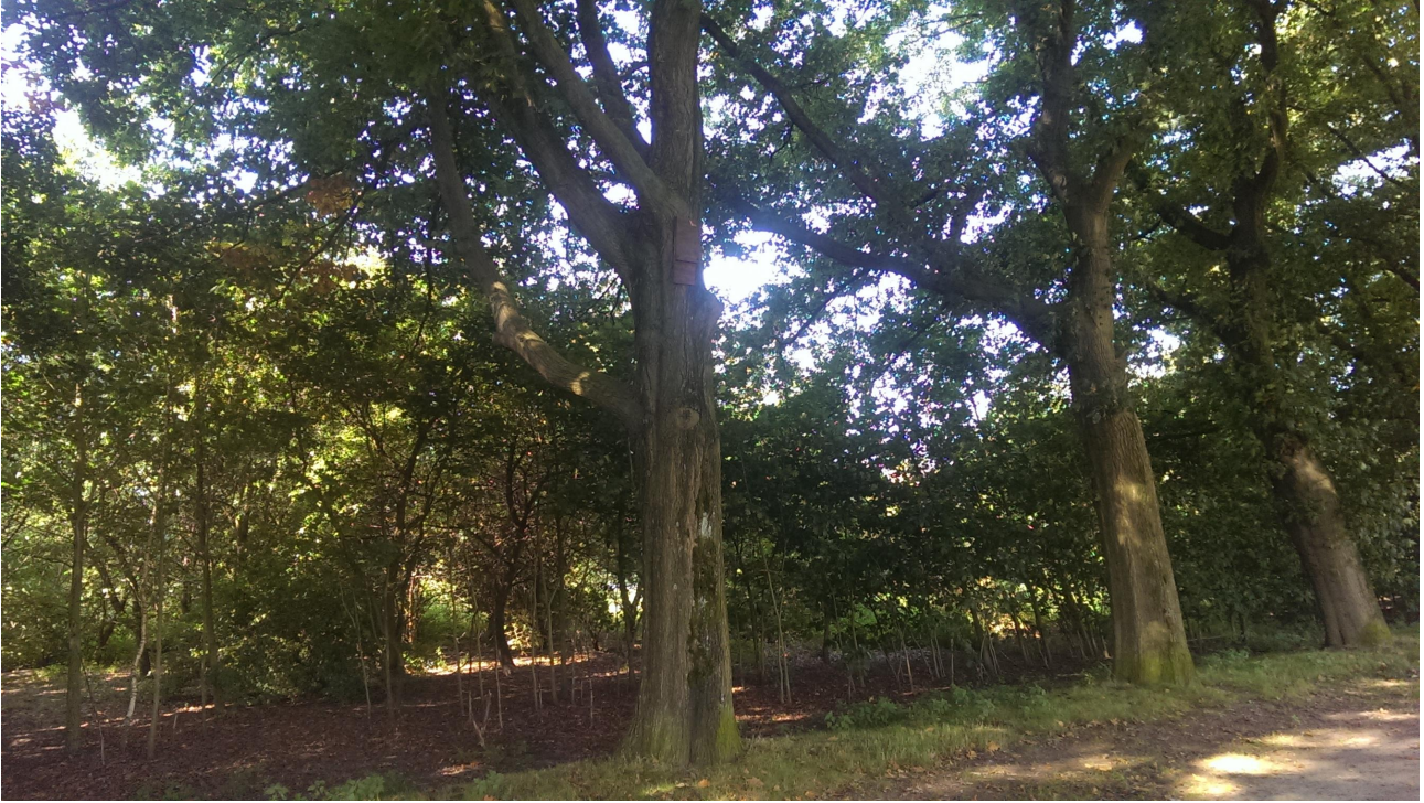
Afbeelding 1. Laan met Amerikaanse eiken nabij het plangebied met vleermuiskast (Aangepaste Boshamer) opgehangen aan een van de bomen.