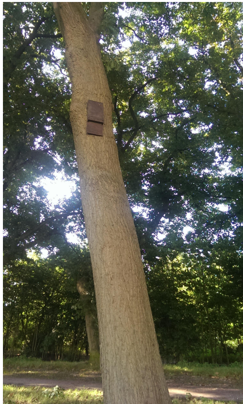
Afbeelding 2. Vleermuiskast opgehangen aan een van de bomen nabij het plangebied.