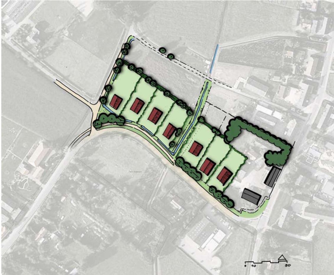
Figuur 1.1 Ontwerp Ruimte voor Ruimte locatie, Oisterwijk