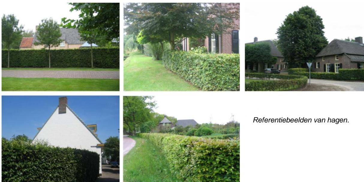
Referentiebeelden van hagen.

De erfafscheidingen worden als hagen of heggen uitgevoerd. De groene erfafscheidingen horen bij het agrarisch cultuurlandschap. De volgende soorten kunnen gebruikt worden als plantmateriaal: beuk, veldesdoorn, liguster, linde en gebiedseigen soorten.