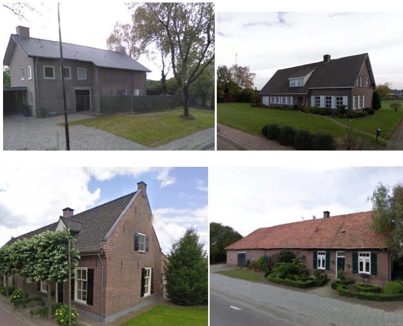
Voorbeelden woningen in de omgeving

De 8 nieuwe woningen in de Heuvelstraat aan de Vinkenbergh worden ingepast in twee losse linten, de Vinkenbergh en de Heuvelstraat. Binnen dit bestaande lint is de woonbebouwing vaak gerelateerd aan een (vroegere) agrarische functie. De bestaande woningen zijn vaak traditioneel van aard.