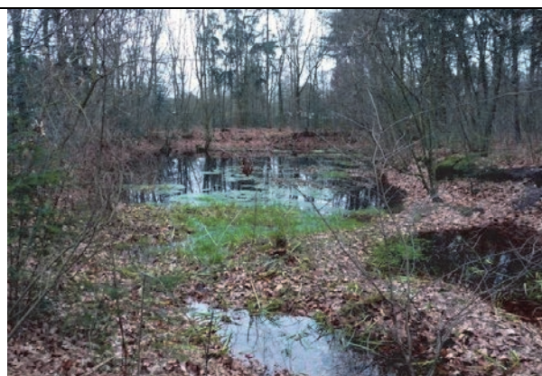
Fig. 10. Overzicht van het vennetje in deelgebied 2. De waterbegroeiing zoals bij een vennetje zoals dit te verwachten is, ontbreekt.