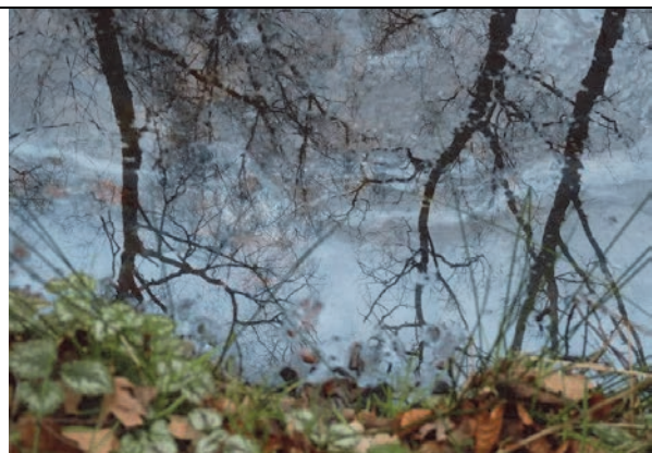
Fig. 5. De sloot aan de zuidkant van het plangebied (deelgebied 1), tussen wandelbos en vakantiewoningen. Er ligt een olieachtige film op het water, wat kan duiden op kwel.