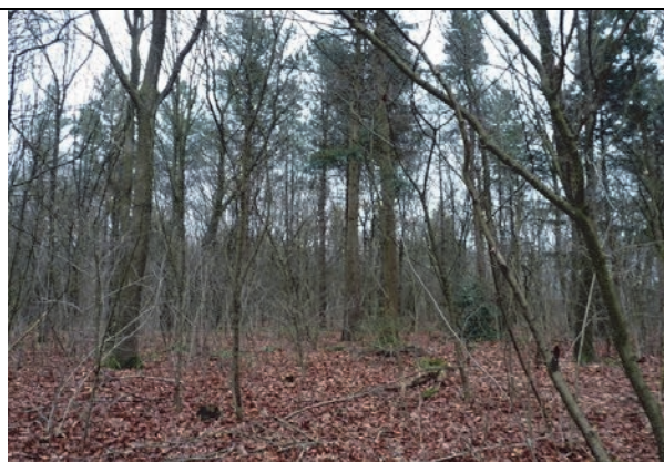
Fig. 8. Impressie van deelgebied 2