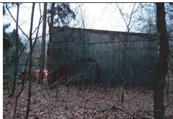
Fig. 16. De veldschuur op deelgebied 4.