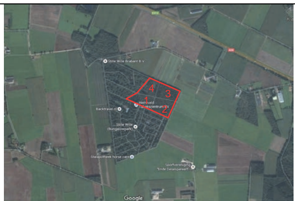
Fig. 2. Ligging van het plangebied (rood omlijnd). Het plangebied is voor de beschrijving ingedeeld in 4 vlakken.