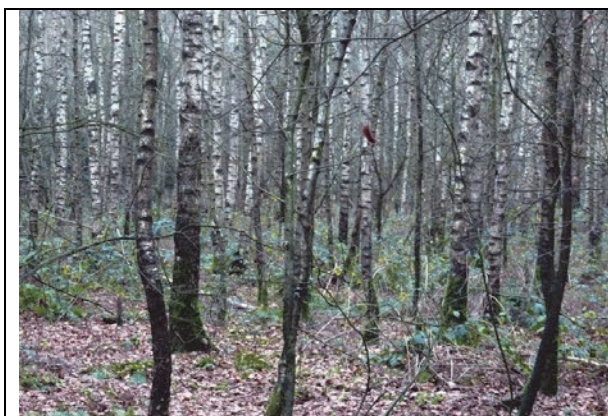
Fig. 15. Deelgebied 4, met vooral berken.