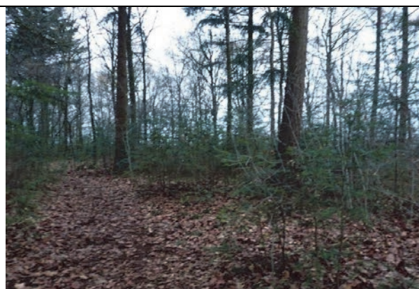
Fig. 12. Impressie van deelgebied 3 meet veel sparrenopslag.