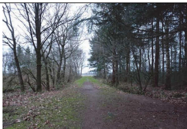
Fig. 14. De scheidingsweg tussen deelgebied 3 en deelgebied 4.