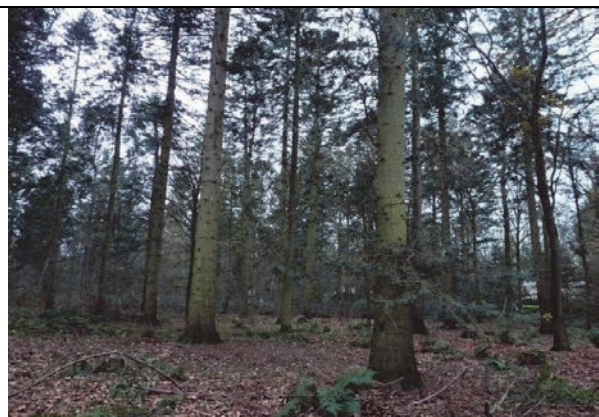
Fig. 3 Impressie van het westelijk deel van het bosperceel (deelgebied 1).