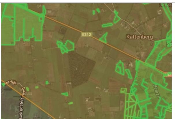
Fig. 16. Ligging van het plangebied ten opzichte van de voormalige EHS (groen) en het Nationale Landschap (oranje).