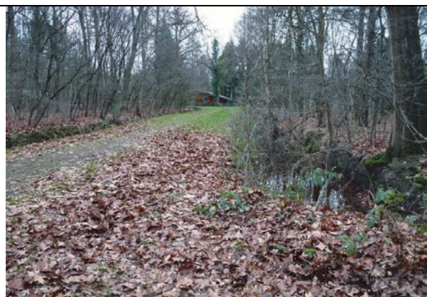
Fig. 7. Het wandelpad tussen deelgebied 1 en deelgebied 2 met aan beide kanten een waterhoudende sloot.