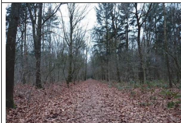
Fig. 11. Het pad wat deelgebied 2 scheidt van deelgebied 3