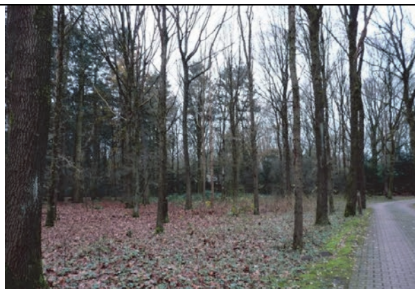
Fig. 4. Verhard pad door het westelijk deel van het bos, (deelgebied 1)