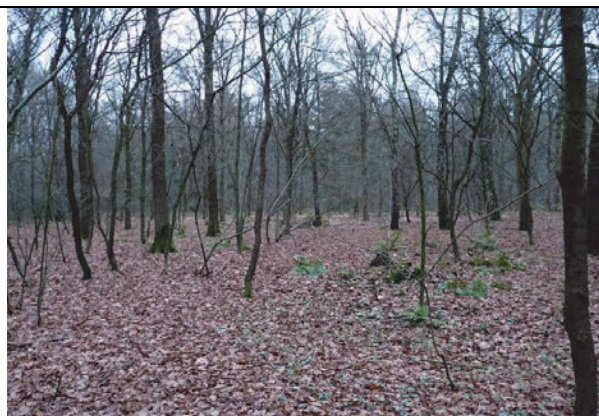
Fig. 6. Oostelijk deel van deelgebied 1, met veel jonge Amerikaanse eik en Amerikaanse vogelkers.