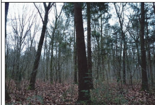
Fig. 13. Deelgebied 3, met sparrenopslag en Amerikaanse vogelkers tussen de dennenbomen in.