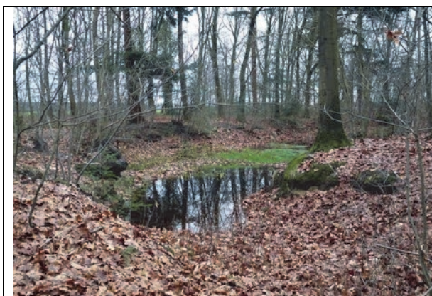
Fig. 9 het vennetje in het oostelijk gedeelte van deelgebied 2. Het vennetje en zijn omgeving ligt vol met bladeren