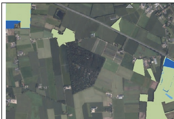
Fig. 15. Ten noordwesten van het plangebied ligt een deel van het Brabants Natuurnetwerk.