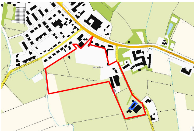
Figuur 1 Ligging plangebied (rood omlijnd) en schuur met vaste rustplaats Kerkuil (blauwe omlijning) aan de zuidoostzijde van Spoordonk, gemeente Oirschot

Plangebied Lubberstraat ligt ten zuiden van de kern Spoordonk, in de gemeente Oirschot (figuur 1). De locatie wordt aan de noordzijde begrensd door achterperceelsgrenzen van woningen aan de Merodelaan en de Spoordonkseweg. Aan de westzijde wordt de planlocatie begrensd door de Lubberstraat. Aan de zuidzijde wordt de locatie begrensd door landbouwpercelen. Aan de oostzijde bevindt zich een waterloop. De locatie Lubberstraat bestaat voornamelijk uit akkerbouwpercelen. Tevens zijn enkele kleinere percelen in gebruik als grasland en paardenweide. Er zijn daarnaast een tweetal landbouwbedrijven in het zuidoostelijke deel aanwezig, aan de Lubberstraat 2A en 4. In figuur 2 is een schets van de voorgenomen inrichting weergegeven.