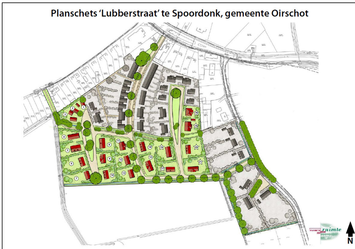
Figuur 2 Planschets voorgenomen inrichting RvRlocatie Lubberstraat, gemeente Oirschot