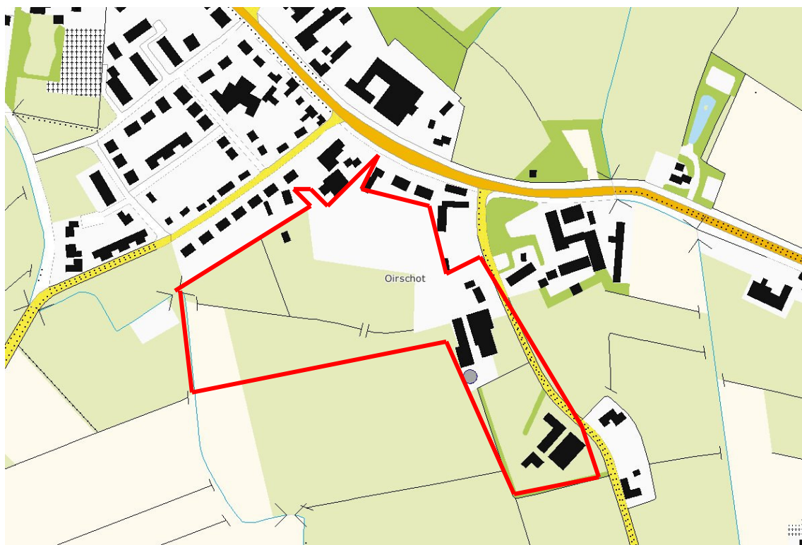
Figuur 1: Plangebied Lubberstraat (rood omlijnd)

De Ruimte voor Ruimte-locatie Lubberstraat ligt ten zuiden van de kern Spoordonk, in de gemeente Oirschot (figuur 1). De locatie wordt aan de noordzijde begrensd door achterperceelsgrenzen van woningen aan de Merodelaan en de Spoordonkseweg. Aan de westzijde wordt de planlocatie begrensd door de Lubberstraat. Aan de zuidzijde wordt de locatie begrensd door landbouwpercelen. Aan de oostzijde bevindt zich een waterloop. De Ruimte voor Ruimte-locatie Lubberstraat bestaat voornamelijk uit akkerbouwpercelen waarop maïs verbouwd wordt. Tevens zijn enkele kleinere percelen in gebruik als grasland en paardenweide.