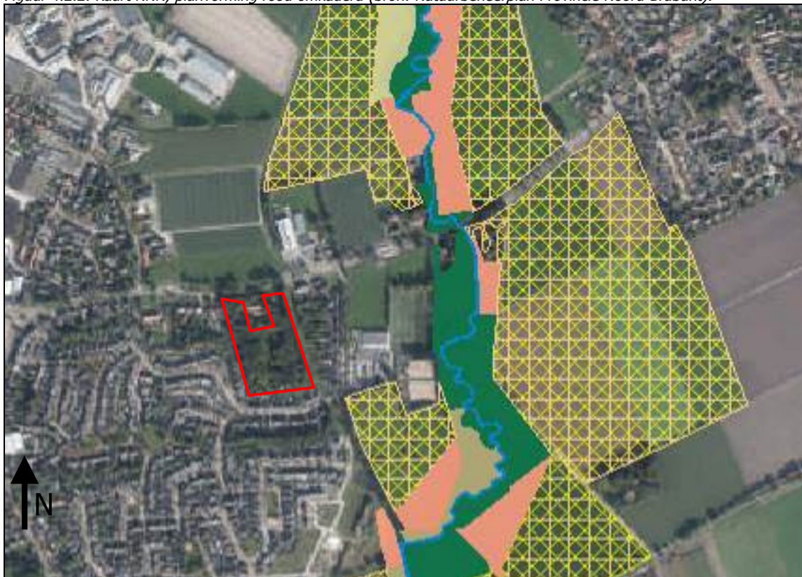
Figuur 4.2.2: Kaart NNN, planvorming rood omkaderd.

Het plangebied maakt geen onderdeel uit van het Nationaal Natuurnetwerk. De ligging van gebieden die onderdeel uitmaken van NNN zijn in het navolgende figuur (4.2.2) weergegeven. Het dichtstbijzijnde gebied dat behoort tot het NNN betreft de meanderende aftakking van de Kleine Beerze ten oosten van het plangebied. Hier ter plaatsen zijn de NNN typen: ` Dennen-, eiken- en beukenbos (15.02) en Beek en Bron (N03.01) toegekend. Met de voorgenomen planontwikkeling is er geen sprake van directe vernietiging van het NNN. Aangezien het beoogde plan geen directe relatie heeft met een gebied dat is aangewezen als NNN, geen verbindende functie vervult en gezien het toekomstige gebruik zijn negatieve effecten uit te sluiten. Van negatieve uitstralingseffecten door geluid, licht en verdroging op het Nationaal Natuur Netwerk is geen sprake.