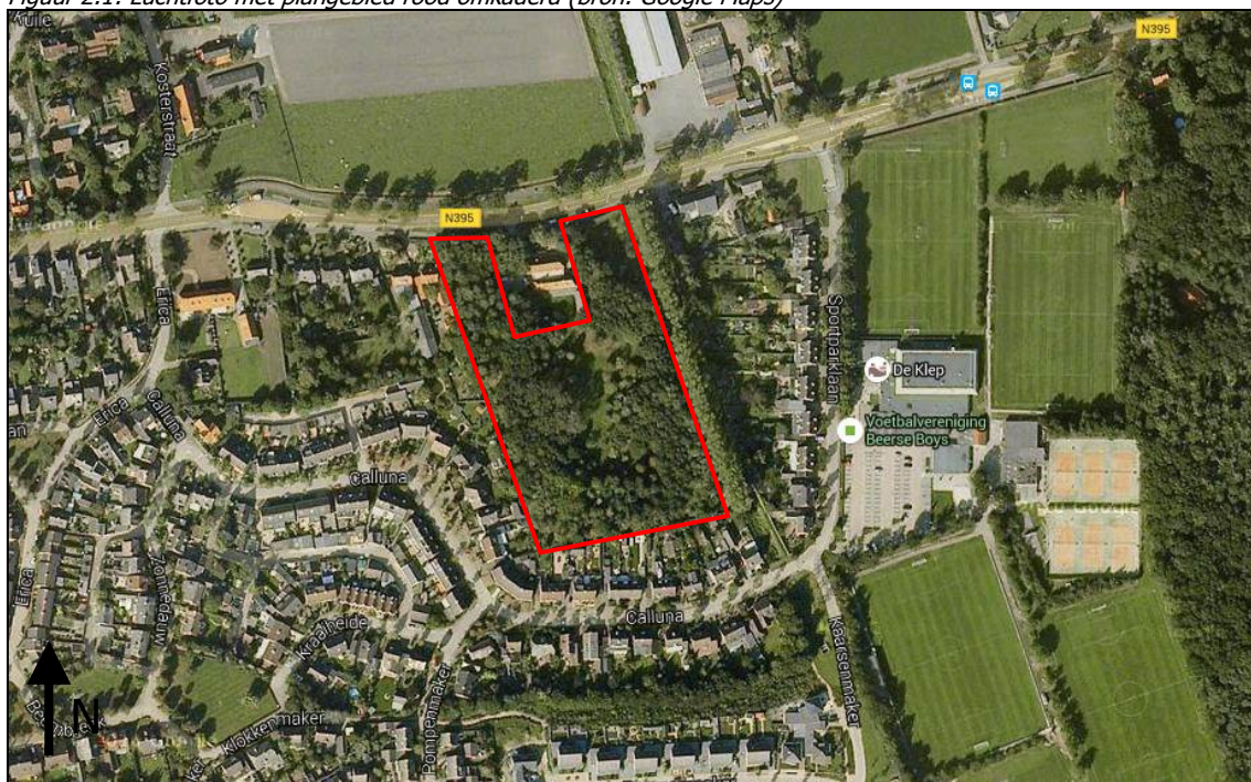
Figuur 2.1: Luchtfoto met plangebied rood omkaderd

Het plangebied is gelegen in de gemeente Oirschot, aan de oostkant van het dorp Middelbeers. Kadastraal is het volgende bekend kadastrale gemeente Oost-, West- en Middelbeers, sectie G en perceelnummer 2584. In de huidige situatie betreft het plangebied een groot gazon met daar omheen bosschage. In bijlage 1 zijn foto's opgenomen van het plangebied ten tijde van het veldonderzoek op d.d. 9 maart 2016.