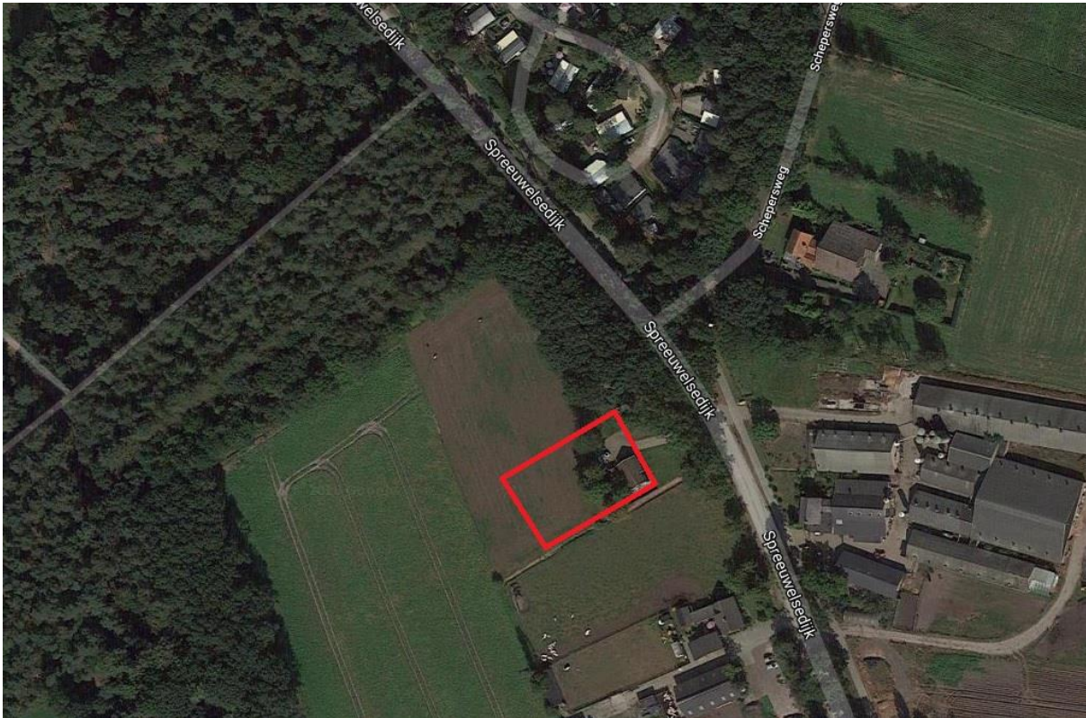
Figuur 1. Ligging van het plangebied.

CroonenBuro5 begeleidt de sloop van een woning aan Spreeuwesdijk 7a te Westelbeers (zie figuur 1). Hiervoor in de plaats zal een nieuwe woning worden gerealiseerd. Om rekening te kunnen houden met beschermde natuurwaarden heeft CroonenBuro5 ecologisch adviesbureau Faunaconsult opdracht gegeven hiertoe een flora- en fauna-inspectie uit te voeren.