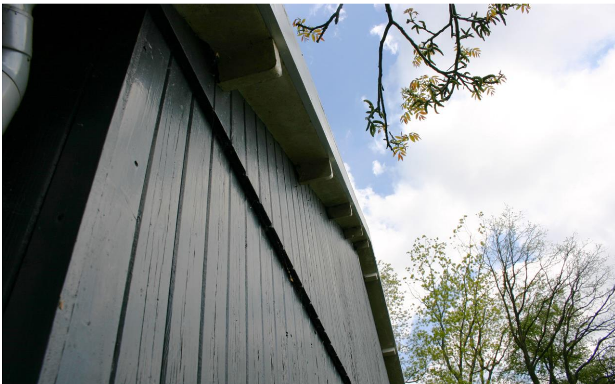
Figuur 4. De houten gevelbetimmering is nauw aansluitend.

Direct onder de onderste rij dakpannen op het huis bevindt zich een lat die vogels als de huismus de toegang versperd. De openingen onder het dak van het schuurtje zijn met bouwschuim afgedicht (zie figuur 5). Ook zijn tijdens het veldbezoek geen huismussen waargenomen. Het is dus uitgesloten dat er huismusnesten in het plangebied aanwezig zijn.