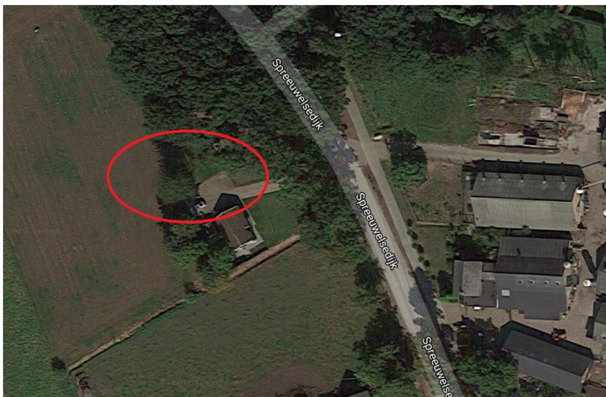
Figuur 3. Het plangebied (rood omcirkeld).

Het plangebied omvat een woning met schuurtje (zie grote foto en kleine foto rechtsonder voorzijde rapport), gazon en een weiland (zie kleine foto linksboven voorzijde). In het plangebied komen boomsoorten voor als linde, esdoorn, paardenkastanje en zomereik. In het gazon en weiland bevinden zich naast grassoorten, zoals Engels raaigras en Timoteegras, diverse planten als duizendblad, paardenbloem, kleine veldkers, zachte ooievaarsbek, herderstasje en hondsdraf. Figuur 3 geeft het plangebied weer.